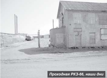
Проходная РКЗ-66, наши дни