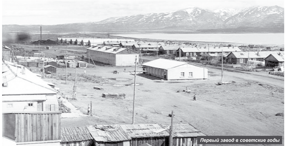
Первый завод в советские годы

Работа по обеспечению транспортом не ограничивалась только этим. Ведь ещё технику надо было ремонтировать, а запчасти без связей не достать. В общем, жаль мне всегда было завгаров, кружились они, как пчёлки. Да и менялись как перчатки.