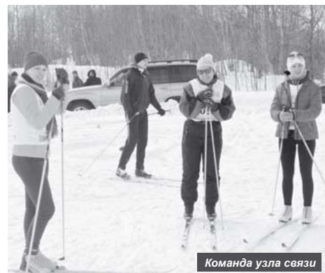
Команда узла связи