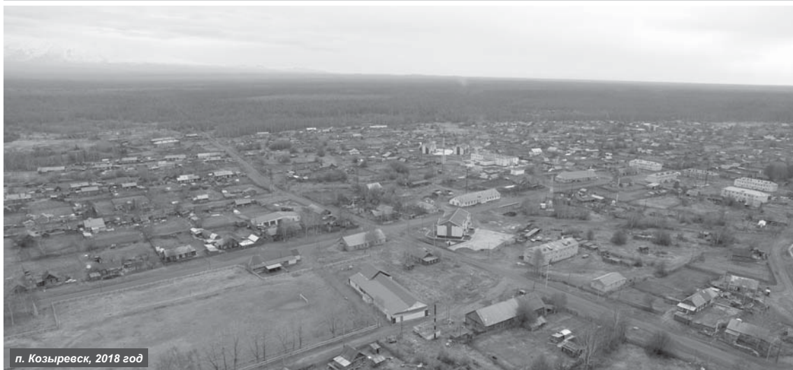
п. Козыревск, 2018 год

25 августа 2019 года посёлку Козыревску Усть-Камчатского района исполняется 279 лет