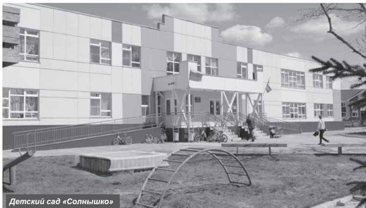
Детский сад «Солнышко»

Многие успешно выращивают теплолюбивые культуры: арбузы, облепиху, дыни, яблоны, сливы, земляную грушу, не говоря уже о традиционных для посёлка культурах – картофеле, капусте, смородине, моркови, зелени, томатах и т.д.