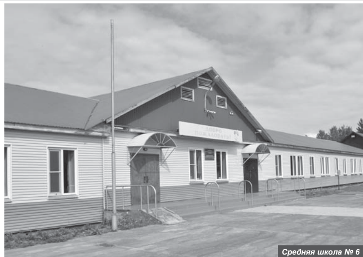
Средняя школа № 6