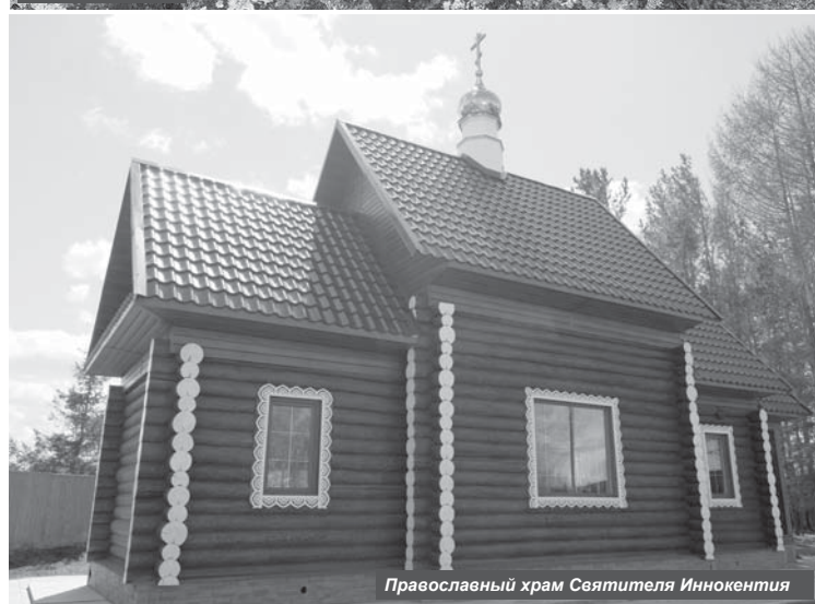
Православный храм Святителя Иннокентия