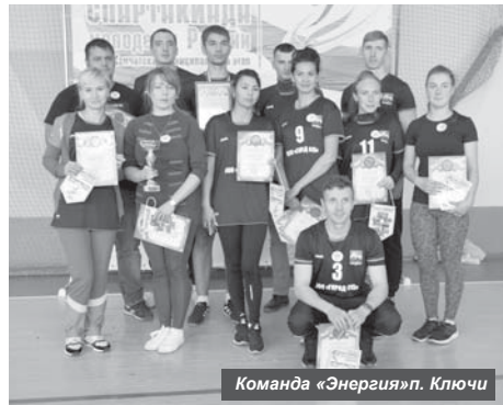
Команда «Энергия» п. Ключи

В Усть-Камчатке 18 августа состоялась муниципальный этап ежегодной спартакиады молодёжи среди сборных трудовых коллективов.