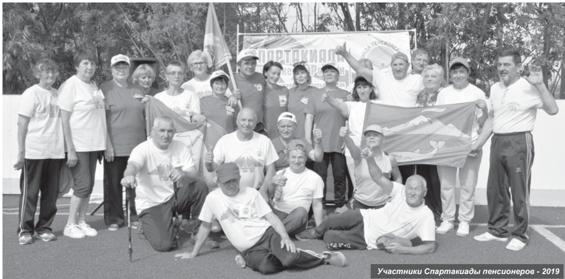
Участники Спартакиады пенсионеров - 2019

27 июля в п. Ключи состоялся муниципальный этап всероссийской спартакиады пенсионеров 2019 года