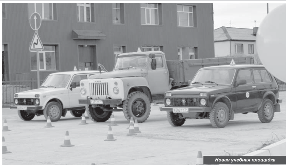
Новая учебная площадка

До 2014 года в райцентре велось обучение водителей категории В и С, но в октябре того же года занятия прекратились в связи с отсутствием специализированного автодрома, наличие которого теперь является обязательным. Обладая обширной теоретической базой, сотрудники техникума испытывали острый недостаток в закрытой площадке, соответствующей современным требованиям.