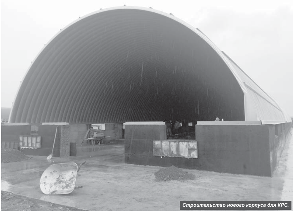
Строительство нового корпуса для КРС.