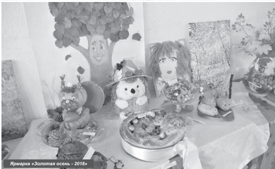
Ярмарка «Золотая осень - 2018»