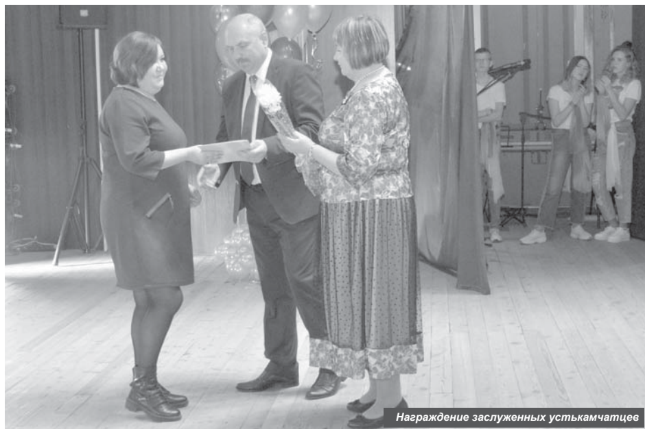
Награждение заслуженных устькамчатцев