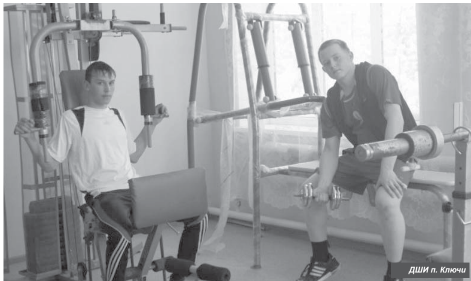
ДШИ п. Ключи