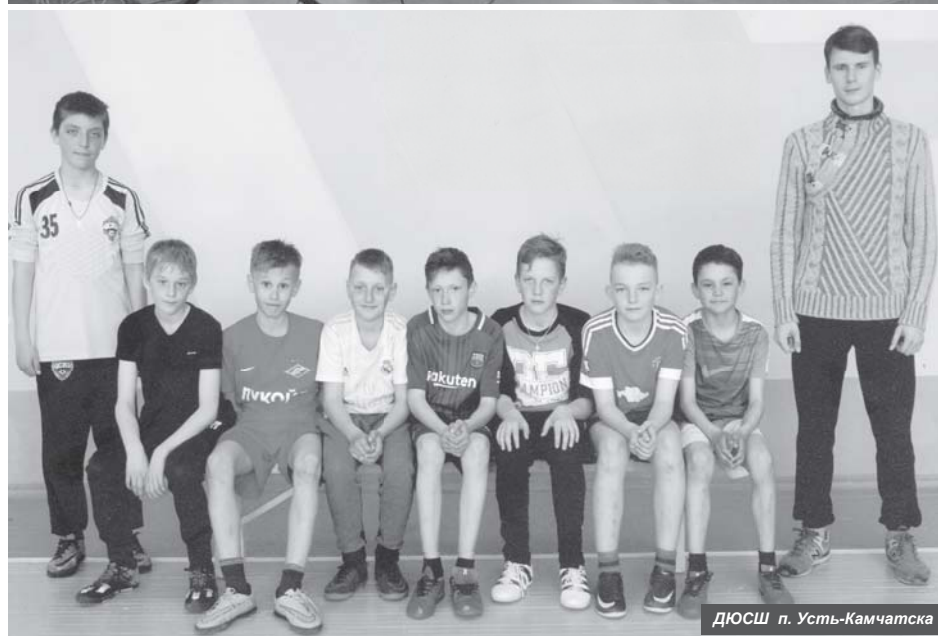
ДЮОШ п. Усть-Камчатск