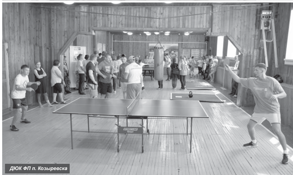
ДЮК ФП п. Козыревска