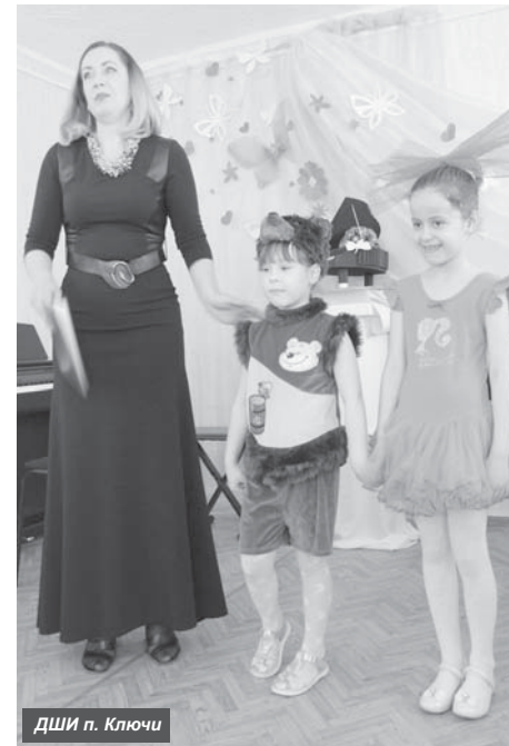
ДШИ п. Ключи