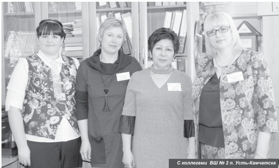
С коллегами ВШ № 2 п. Усть-Камчатка