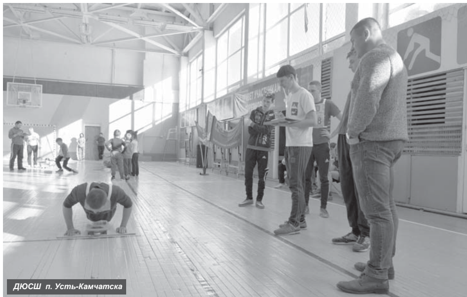
ДЮСШ п. Усть-Камчатка

5 октября в России учителя отметили свой профессиональный праздник. В прошлом выпуске вы узнали об учреждениях общего и технического образования района. А в этом номере мы расскажем об учреждениях дополнительного образования детей.