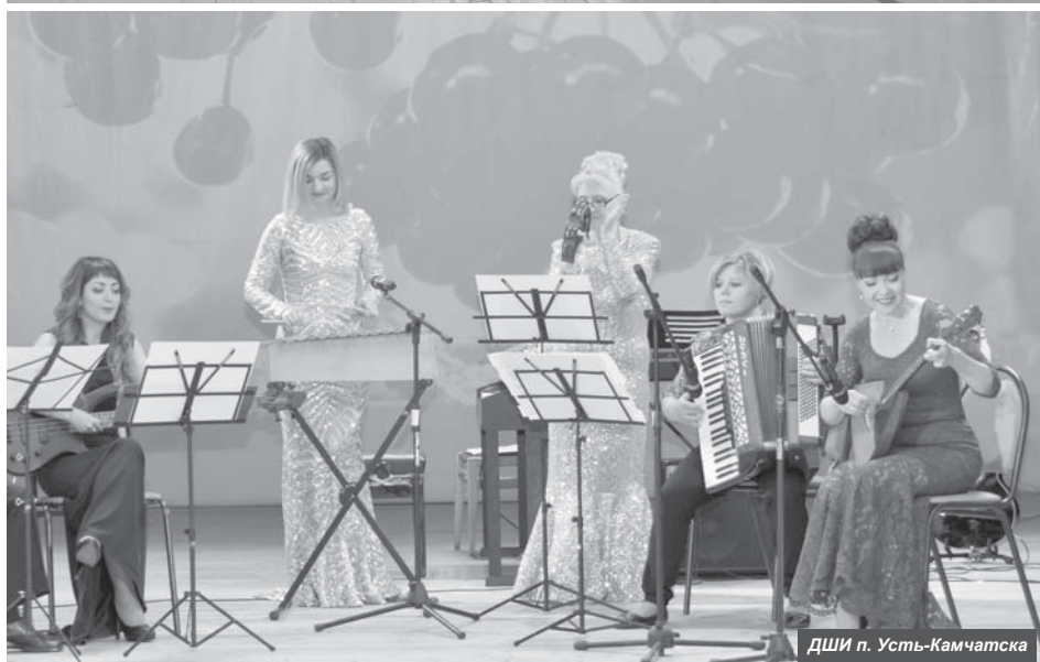
ДШИ п. Усть-Камчатка