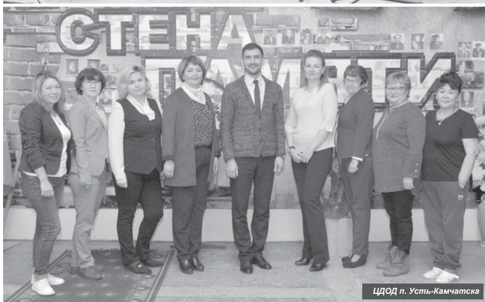
ЦДОД п. Усть-Камчатка

День учителя – одно из значимых осенних торжеств. Педагоги, будь то преподаватель физики либо танцев, в этот день очень рады слышать слова признательности и благодарности от своих учеников. Их можно выразить в стихах или в прозе, а в век развитых коммуникаций не зазорно отправить и короткое поздравительное сообщение. Ведь каждому учителю, в том числе и бывшему, приятно осознавать, что о нём помнят.