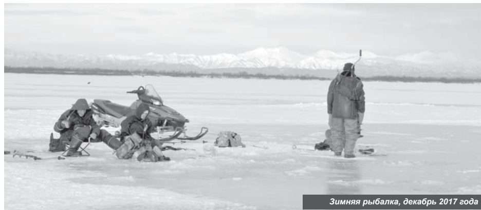
Зимняя рыбалка, декабрь 2017 года

Продолжается работа по наведению порядка на улицах посёлка. Постепенно сносятся руины нежилых домов. После установки в мкр. Погодном крытых павильонов для сбора бытовых отходов, благодаря которым стало заметно меньше мусора на улицах, решено продолжить сооружение таких «домиков». Часть из них к тому же оснащена контейнерами для сбора ртутьсодержащих отходов.