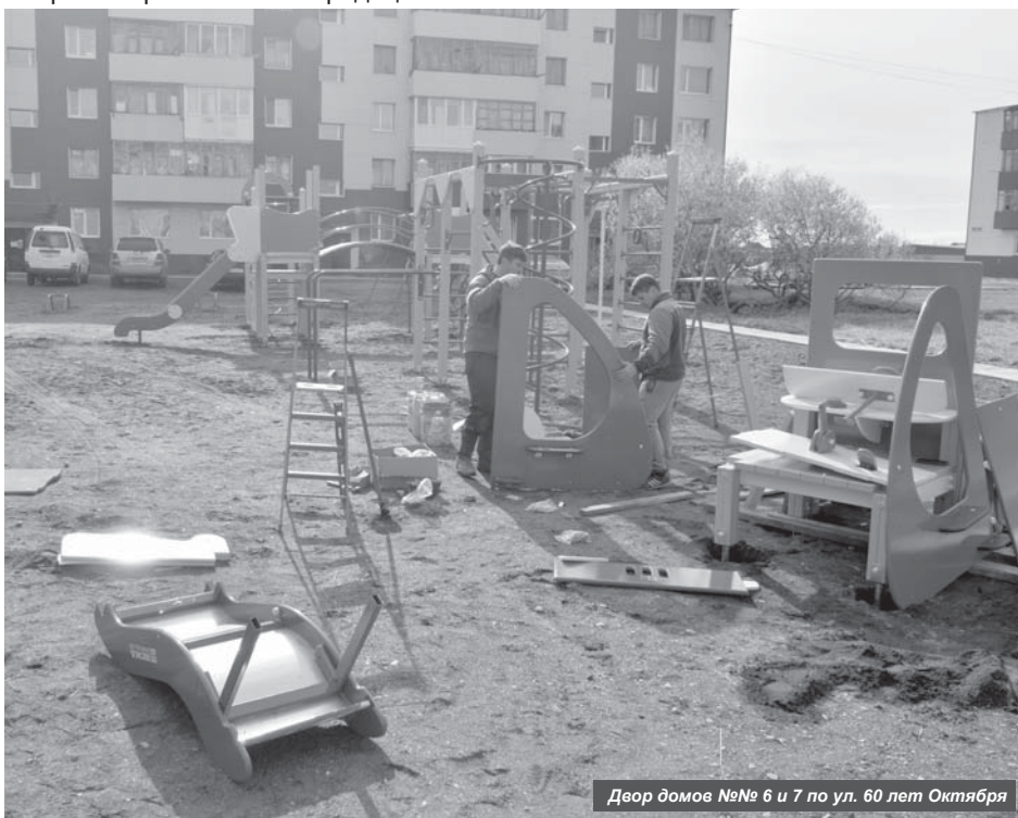
Двор домов №№ 6 и 7 по ул. 60 лет Октября

Вообще природа на протяжении нескольких последних лет преподносит людям сюрпризы и не всегда приятные. Затяжная прошлая осень почти на месяц отсрочила начало зимней рыбалки — на корюшку. Дождь в феврале стал практически нормальным погодным явлением. А в этом году плюсовая температура воздуха зафиксирована в январе. Циклоны приносят не только потепление, но и массу проблем. По предположениям, из-за капризов природы невысоки урожаи овощей усть-камчатских дачников. Активны исполины района, и Усть-Камчатск периодически присыпало вулканическим пеплом.