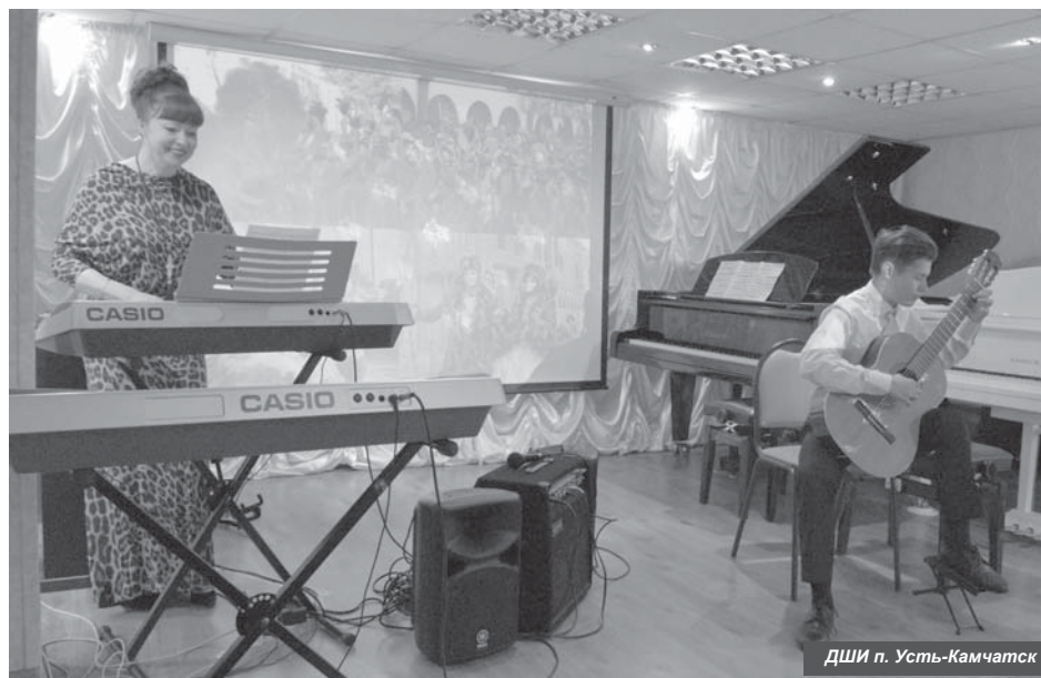
ДШИ п. Усть-Камчатск

В 2018 году учебное заведение участвовало в конкурсе «Лучшая детская школа искусств сельских поселений», где заняло второе место. Воспитанники приняли участие в праздничном концерте, приуроченном ко Дню учителя, с премьерным номером: «Квартет гитаристов». В планах ДШИ – приобретение новых музыкальных инструментов и оборудования, а также участие детей в краевых, всероссийских, международных конкурсах и фестивалях. В 2018 году школа празднует свой 55-летний юбилей.