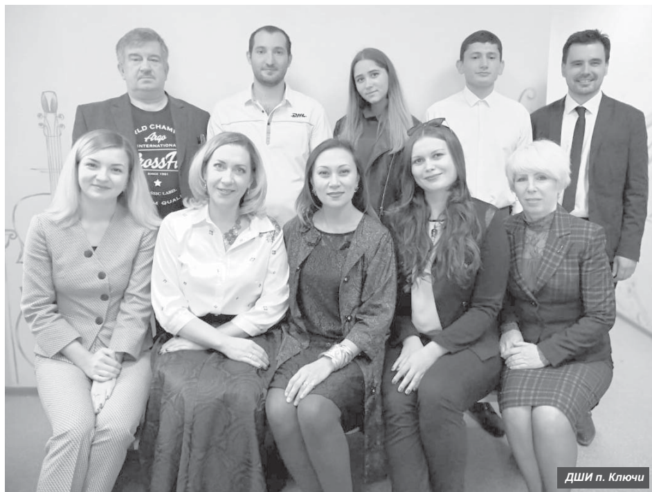
ДШИ п. Ключи