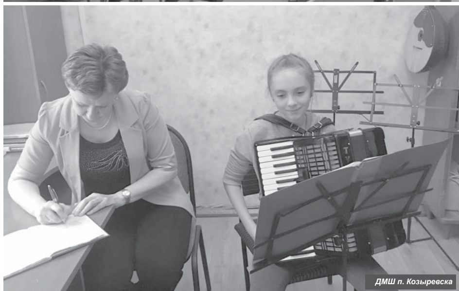
ДМШ п. Козыревска