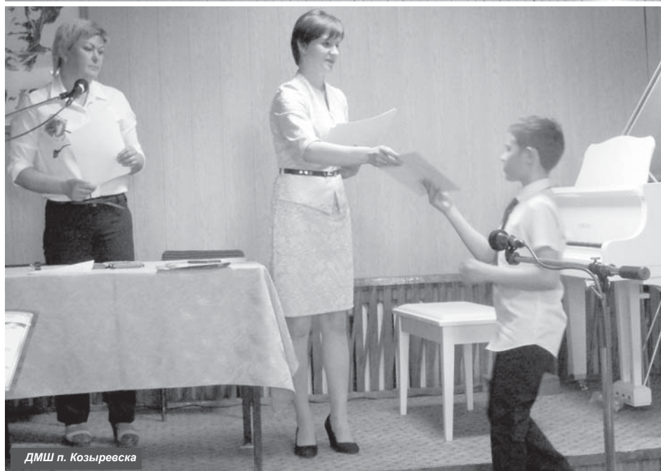
ДМШ п. Козыревска