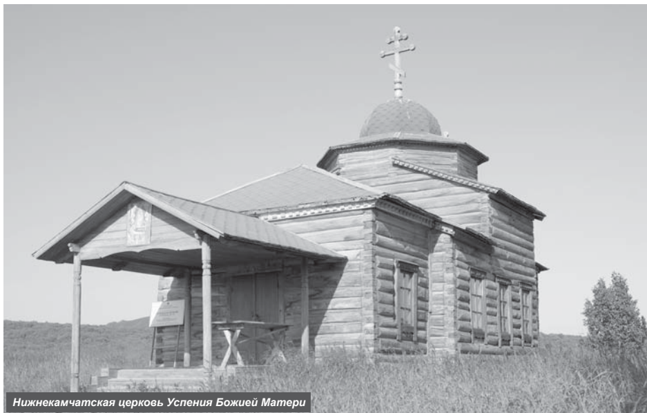
Нижнекамчатская церковь Успения Божией Матери

Приближается очередная годовщина со дня основания посёлка Усть-Камчатка. Чем же запомнится уходящий год?