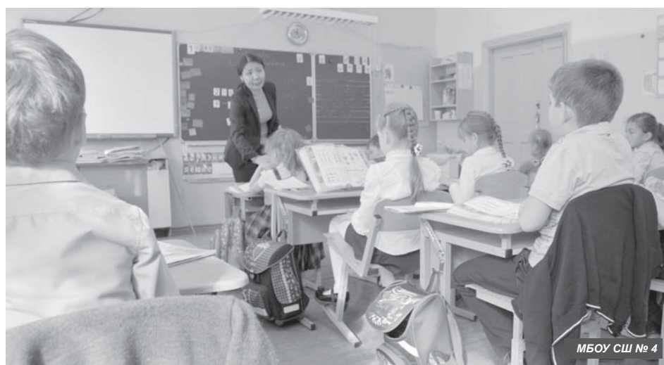
МБОУ СШ № 4