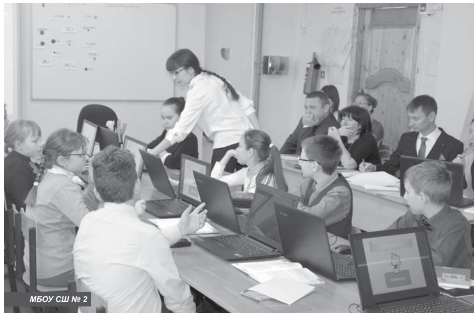
МБОУ СШ № 2