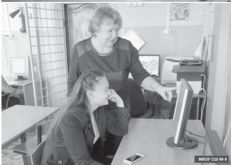
МБОУ СШ № 6