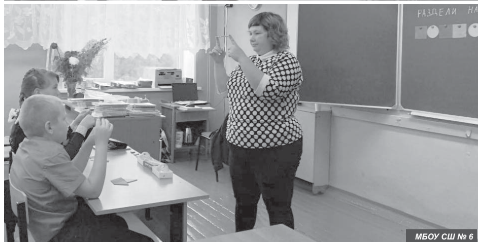
МБОУ СШ № 6

ещё один учитель занял 3 место во Всероссийском конкурсе педагогического мастерства «История в школе: традиции и новации».