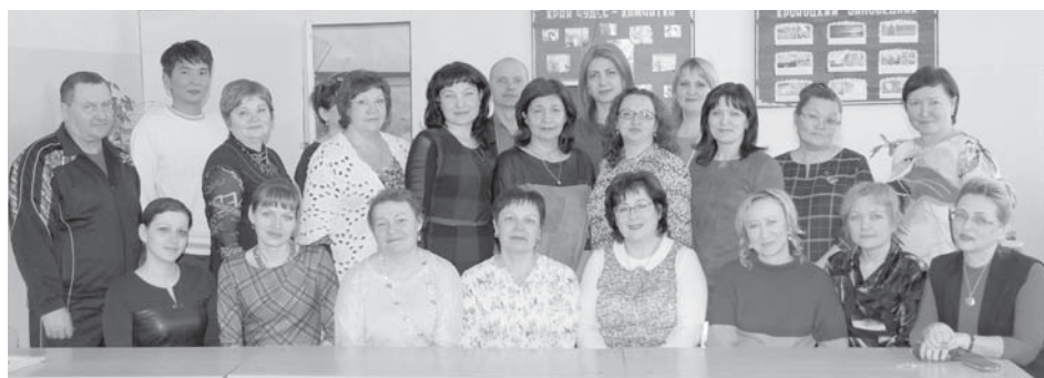
МБОУ СШ № 5