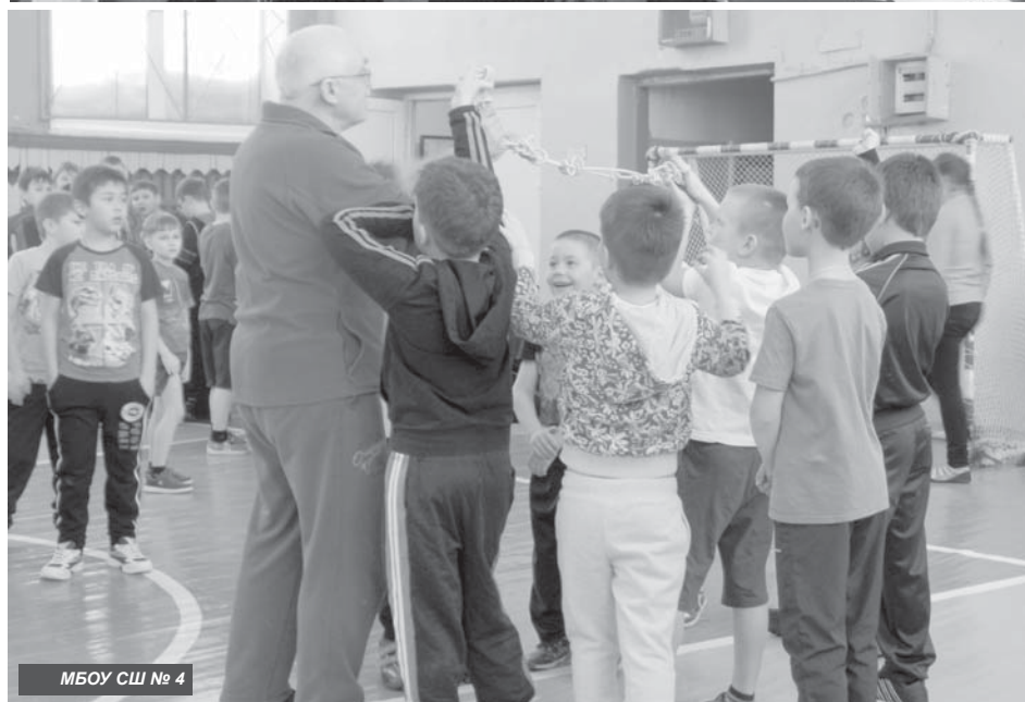
МБОУ СШ № 4