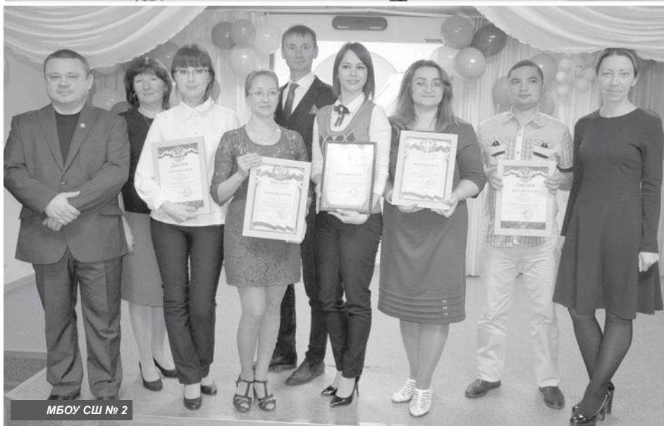
МБОУ СШ № 2