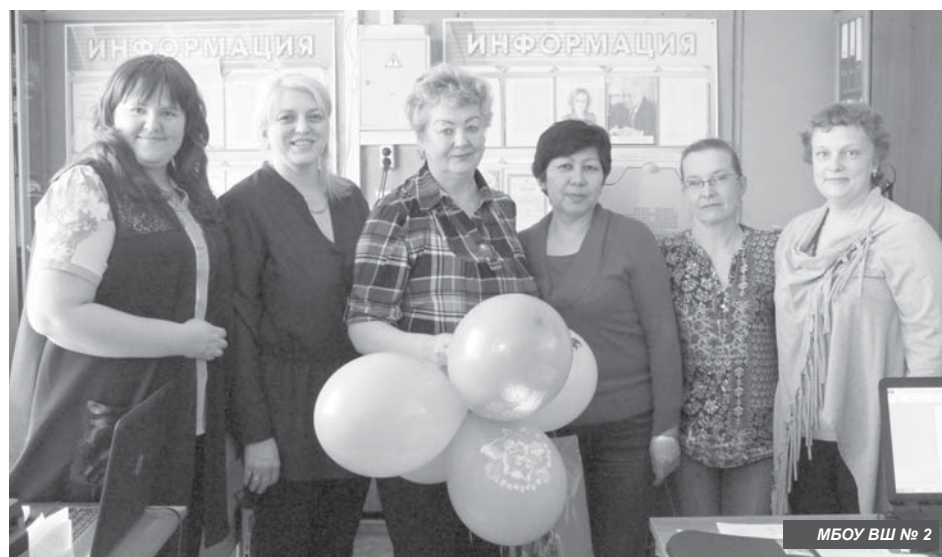
МБОУ ВШ № 2