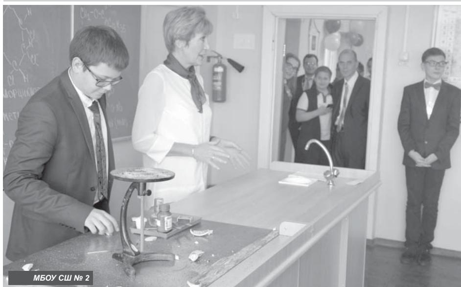
МБОУ СШ № 2

5 октября в России отмечают один из самых главных осенних праздников — День учителя. В этом выпуске предлагаем вам узнать о педагогических работниках общеобразовательных школ района, филиала «Камчатского индустриального техникума» и вечерней школы Усть-Камчатки. А в следующем номере мы расскажем об учреждениях дополнительного образования детей.