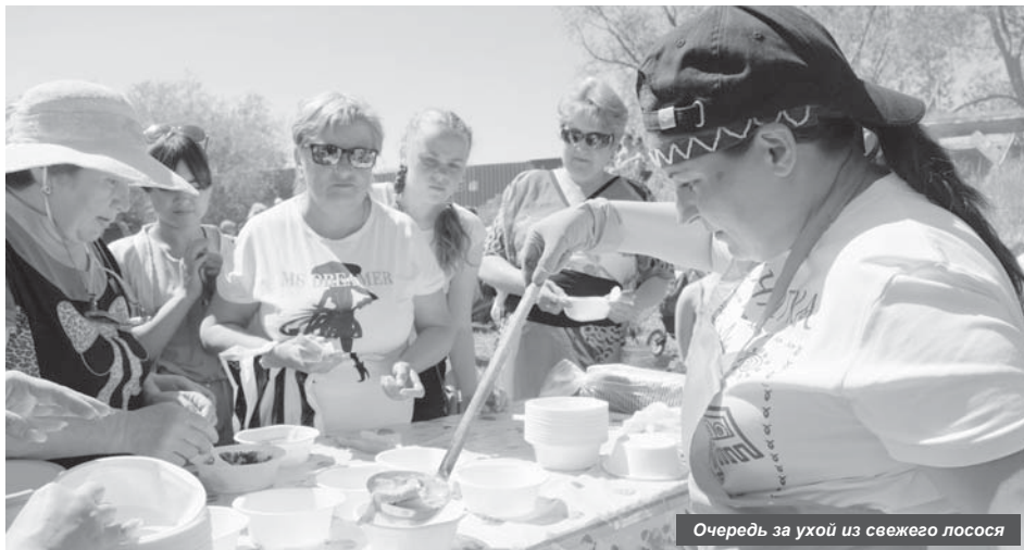
Очередь за ухой из свежего лосося