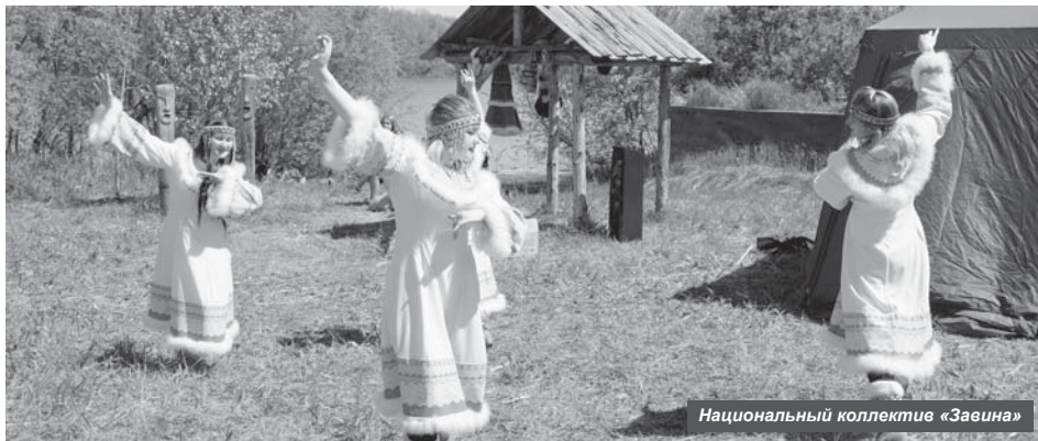
Национальный коллектив «Завина»

«Готовили по обычному рецепту, никаких секретов. Использовали чавычу,