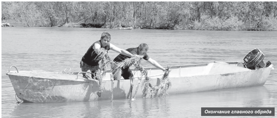
Окончание главного обряда

Жители п. Ключи отметили большой национальный праздник — День первой рыбы