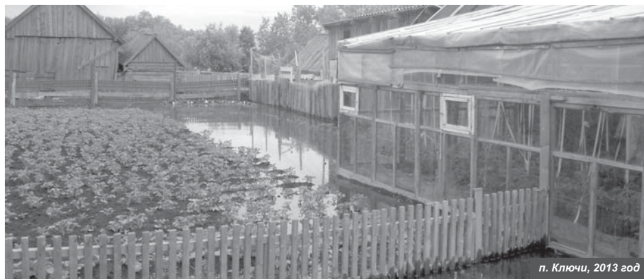
Весенний подъём воды

На заседании комиссии по предупреждению и ликвидации последствий чрезвычайных ситуаций и обеспечению пожарной безопасности администрации Усть-Камчатского района приняты меры по прохождению паводкового и пожароопасного периодов.