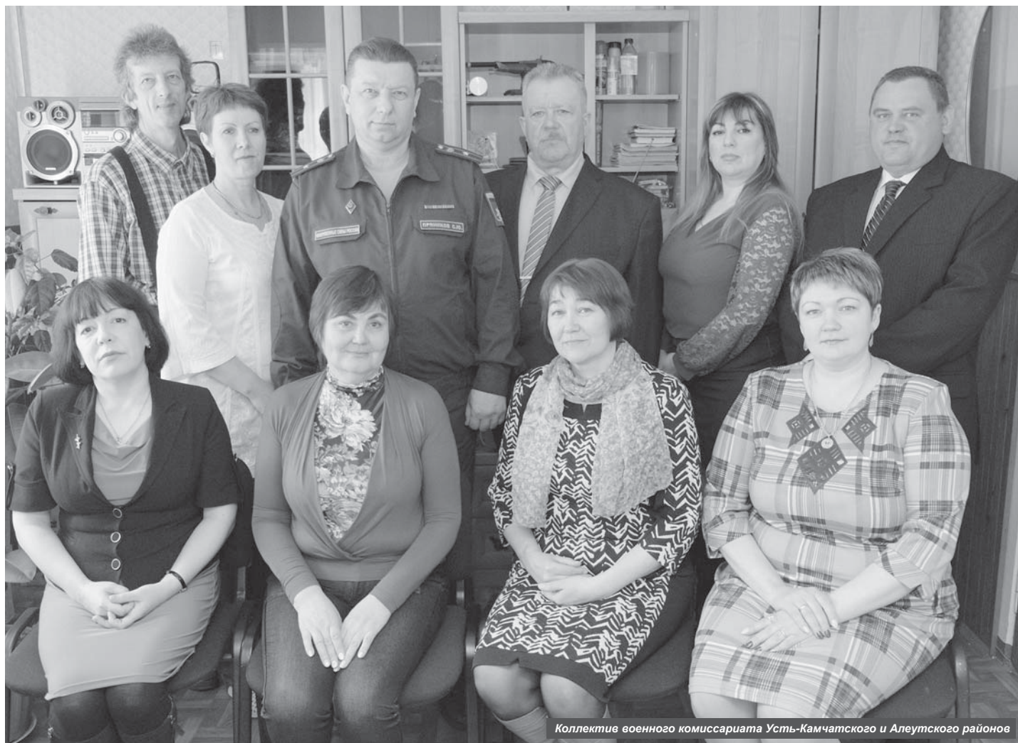
Коллектив военного комиссариата Усть-Камчатского и Алеутского районов

8 апреля 2018 года отмечается столетняя годовщина образования органов местного военного управления (День сотрудников военных комиссариатов). 4 мая военный комиссариат Усть-Камчатского и Алеутского районов отмечает 80-летие со дня основания.