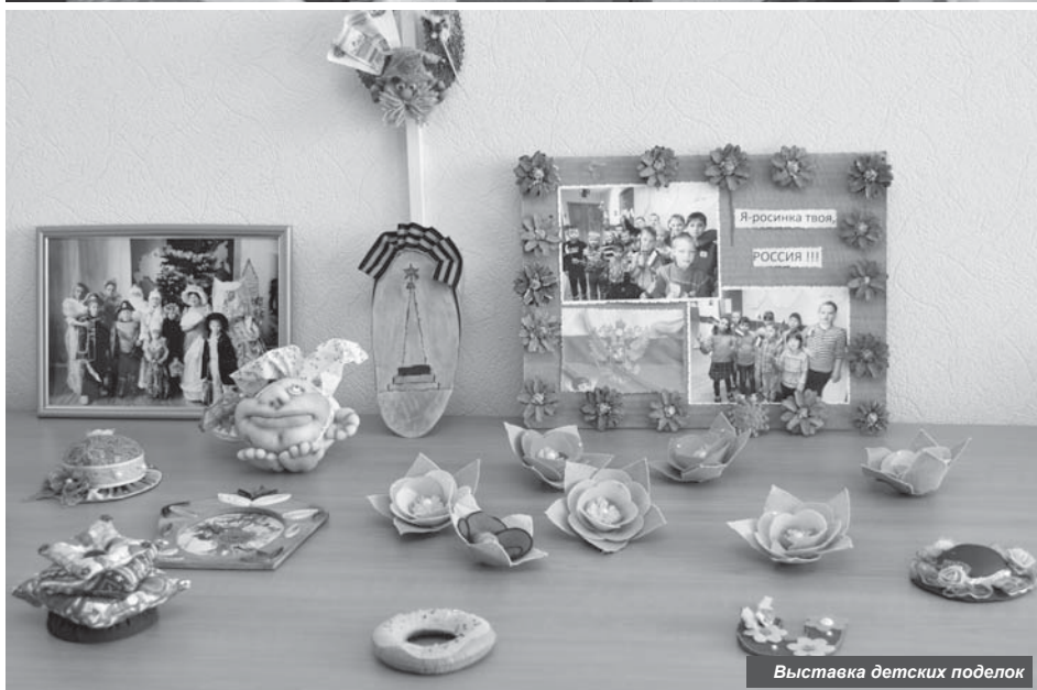
Выставка детских поделок