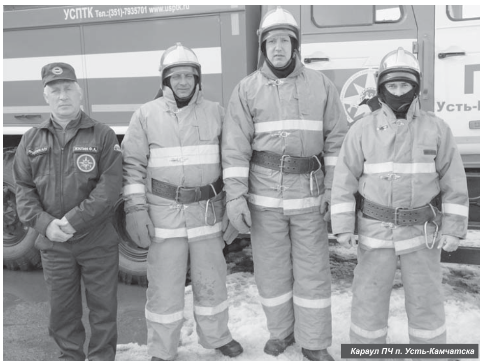
Караул ПЧ п. Усть-Камчатска

30 апреля пожарные России отметят свой профессиональный праздник.