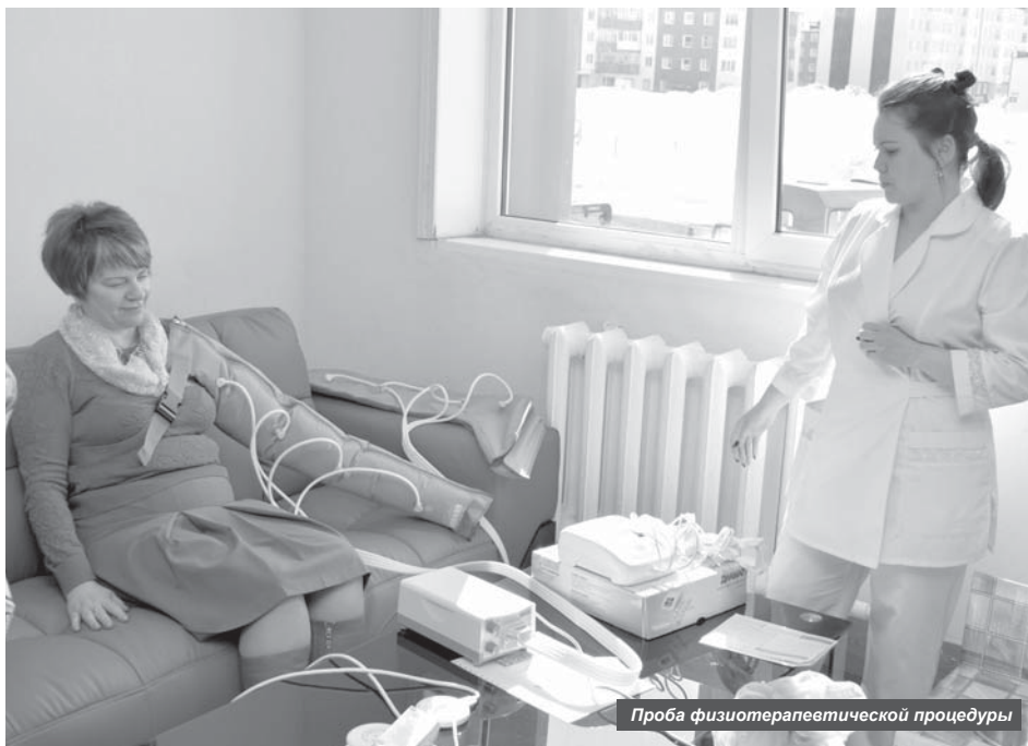
Проба физиотерапевтической процедуры

Устькамчатцы познакомились с «Комплексным центром социального обслуживания населения» на Дне открытых дверей.