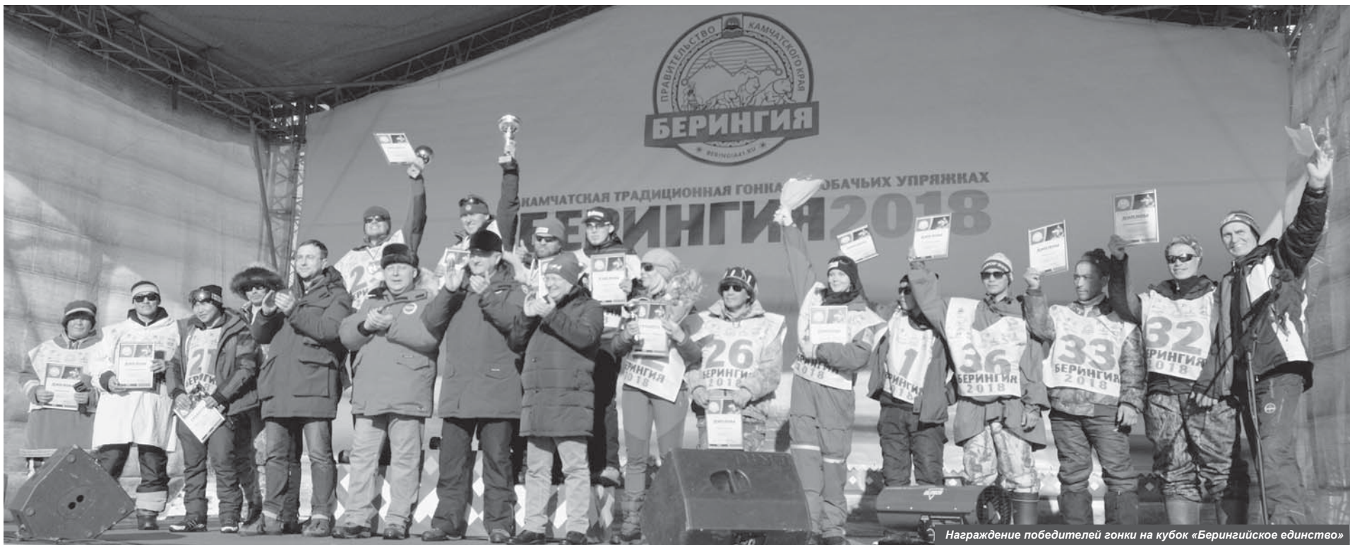
Награждение победителей гонки на кубок «Берингийское единство»

10 марта в Милькове состоялся грандиозный праздник по случаю начала «Берингии-2018». А на следующий день 15 каюров вышли на старт гонки. Им предстоит преодолеть рекордную дистанцию, протяжённостью порядка 2100 километров, и финишировать в посёлке Марково на Чукотке.