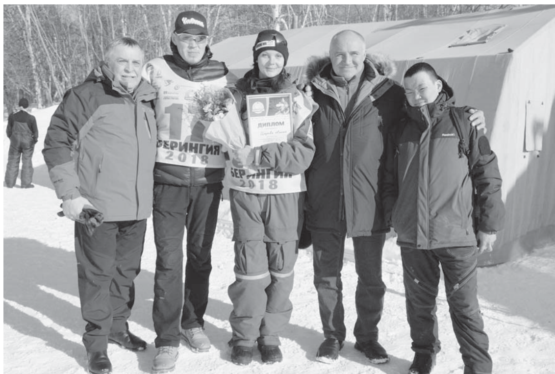
Первые лица Усть-Камчатского района с участниками гонки

Первый этап: Мильково – Долиновка. Вечером 11 марта все каюры успешно финишировали в первом контрольном