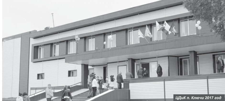
ЦДиК п. Ключи 2017 год