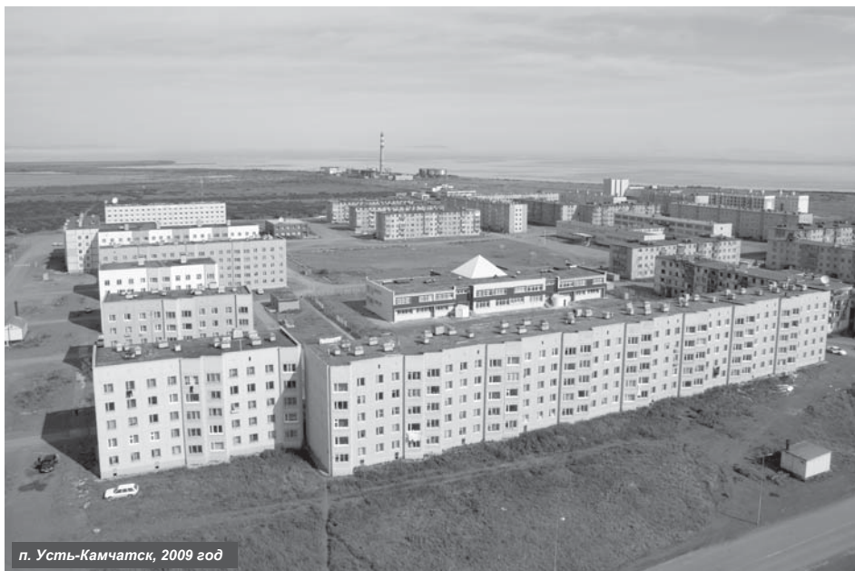
п. Усть-Камчатск, 2009 год

Камчатцы оценивают путь, пройденный страной, регионом и родным районом, за 18 лет