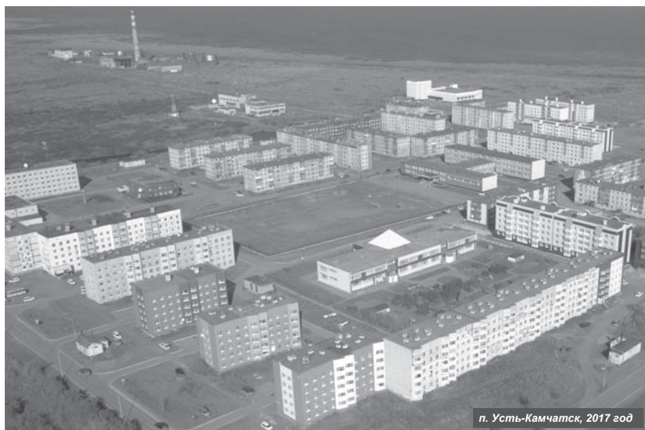
п. Усть-Камчатск, 2017 год

Совсем скоро наступит день, когда граждане нашей большой страны в очередной раз придут на избирательные участки, чтобы выбрать президента России – лидера, ответственного за её развитие на ближайшие годы. Но чтобы видеть, к чему стремиться, мы должны понимать, от чего пришли и какой путь уже проделан. Поэтому неудивительно, что люди с активной гражданской позицией, неравнодушные к жизни общества занялись подведением итогов.