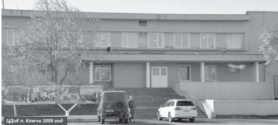
ЦДиК п. Ключи 2009 год