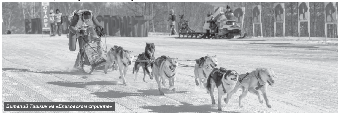
Виталий Тишкин на «Елизовском спринте»