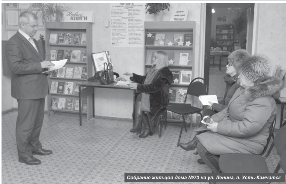
Собрание жильцов дома №73 на ул. Ленина, п. Усть-Камчатск

В 2018 году капитально отремонтируют 10 многоквартирных домов на территории Усть-Камчатского района.