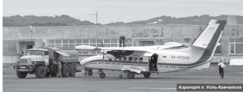
Аэропорт п. Усть-Камчатска