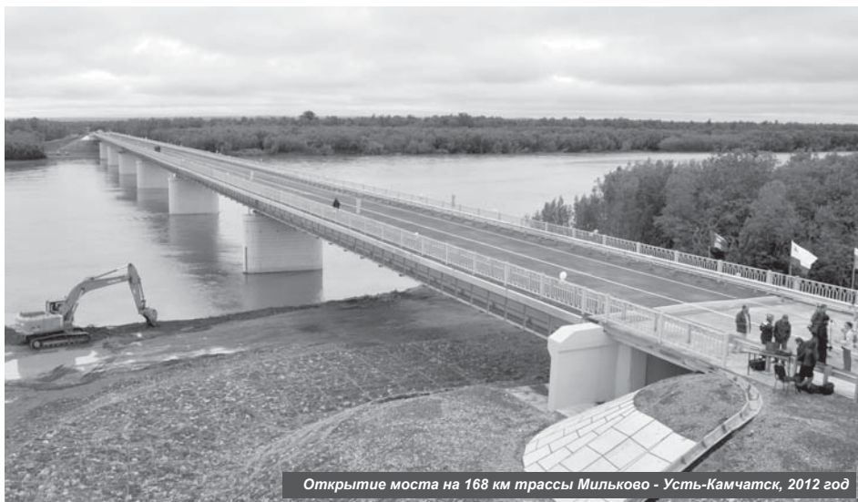
Открытие моста на 168 км трассы Мильково - Усть-Камчатск, 2012 год

Камчатка строит единую транспортную систему, которая обеспечит экономическое и социальное развитие в населённых пунктах региона.