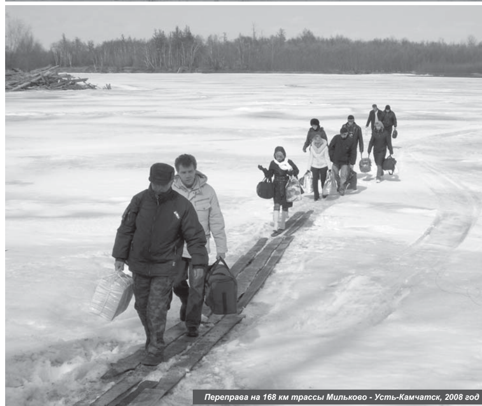
Переправа на 168 км трассы Мильково - Усть-Камчатск, 2008 год