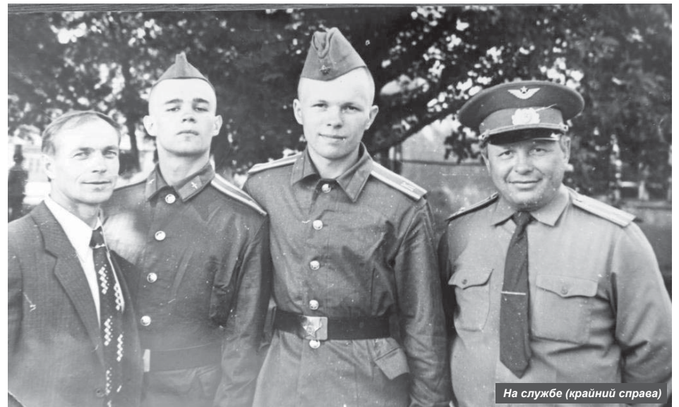
На службе (крайний справа)