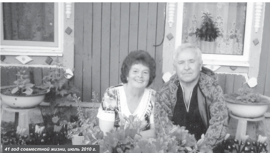
41 год совместной жизни, июль 2010 г.