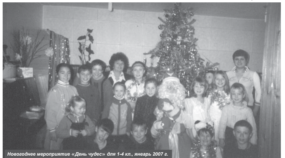
Новогоднее мероприятие «День чудес» для 1-4 кл., январь 2007 г.