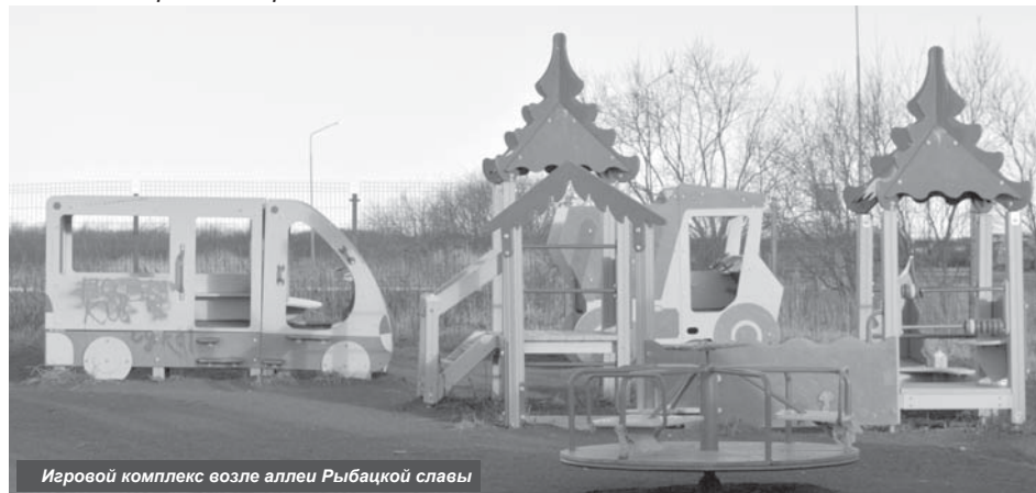
Игровой комплекс возле аллеи Рыбацкой славы