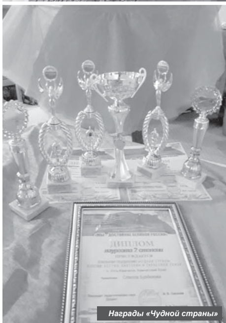
Награды «Чудной страны»