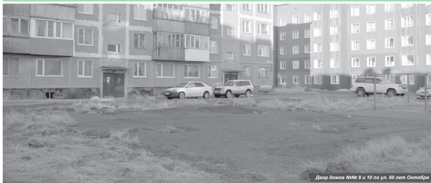
Двор домов №№ 9 и 10 по ул. 60 лет Октября

Масштабный демонтаж детских площадок в Усть-Камчатске вызвал большой общественный резонанс.