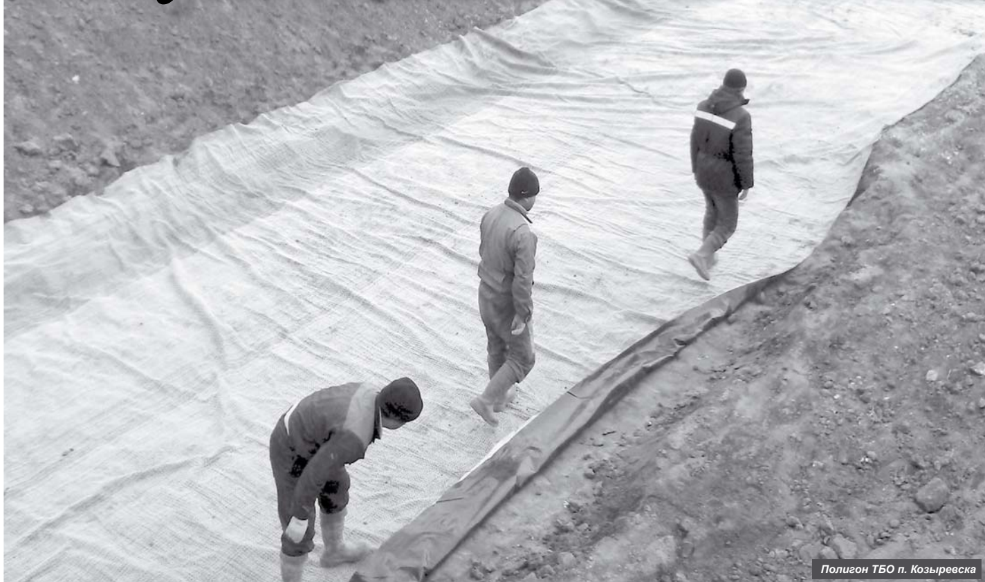
Полигон ТБО п. Козыревска