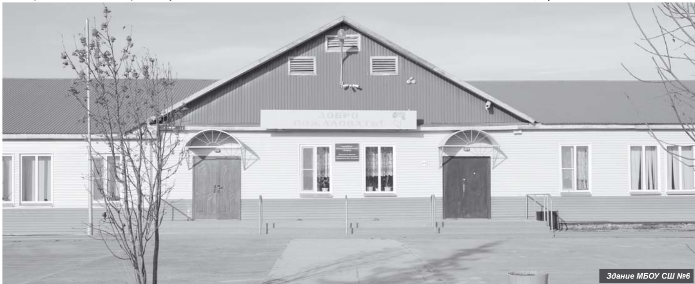
Здание МБОУ СШ №6