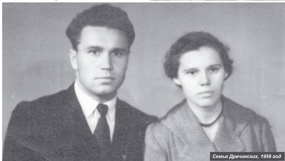
Семья Драчинских, 1959 год