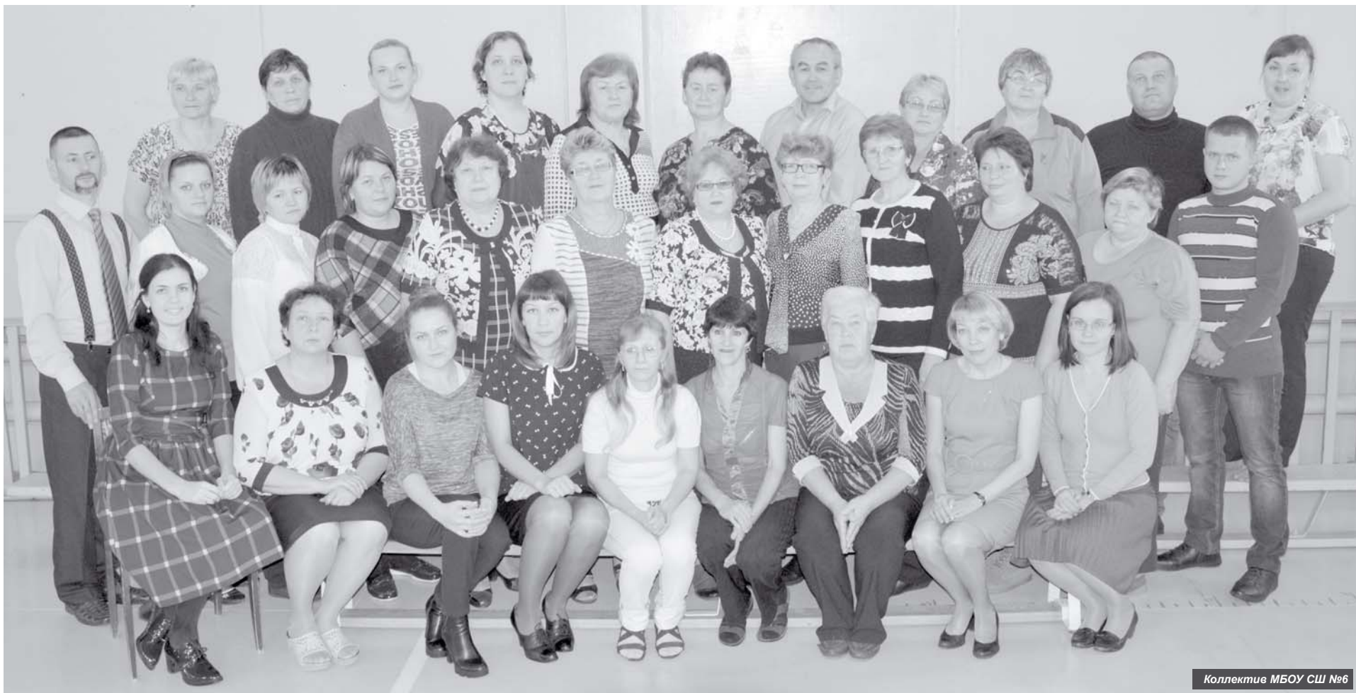
Коллектив МБОУ СШ №6

3 ноября коллектив и ученики школы № 6 п. Козыревска отметят юбилей: учреждению исполняется 85 лет