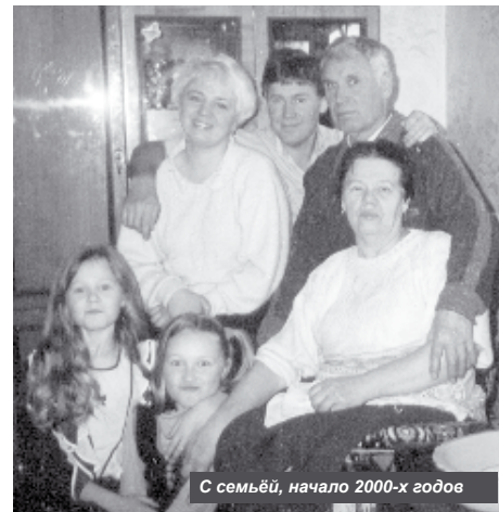
С семьёй, начало 2000-х годов