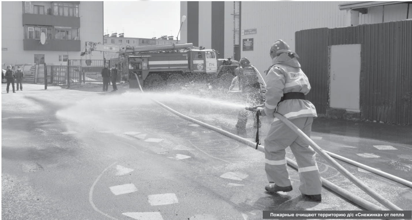
Пожарные очищают территорию д/с «Снежинка» от пепла

В июне отмечена небывалая активность вулкана Шивелуч. В результате чего пепел с исполина основательно припорошил улицы населённых пунктов Усть-Камчатского и частично Мильковского районов.