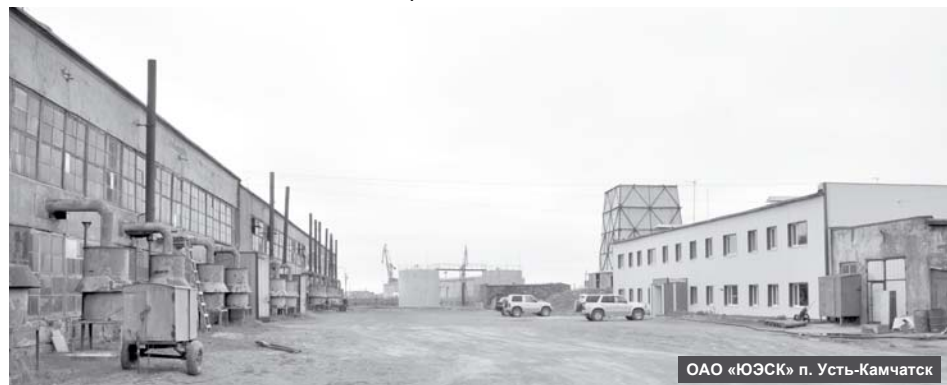
ОАО «ЮЭСК» п. Усть-Камчатск