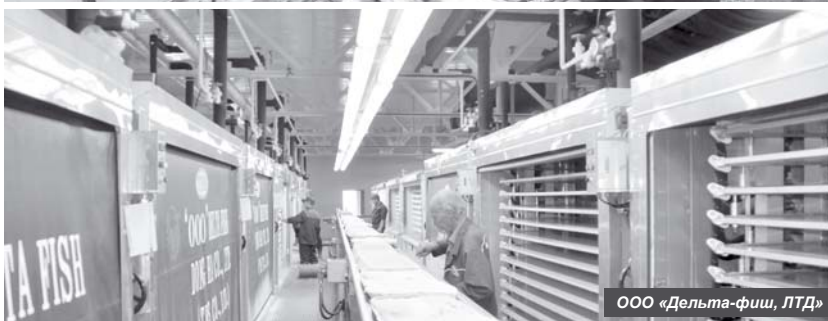
ООО «Дельта-фиш, ЛТД»