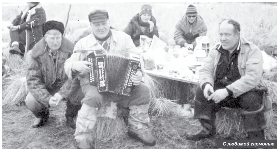
С любимой гармонью