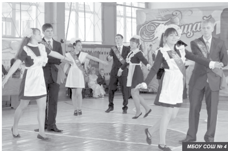
МБОУ СОШ № 4