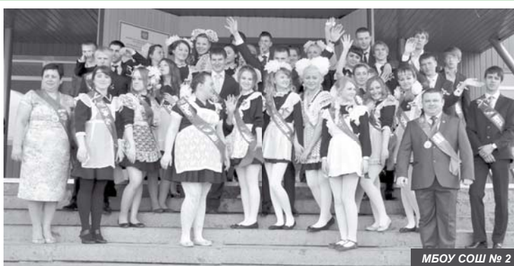
МБОУ СОШ № 2