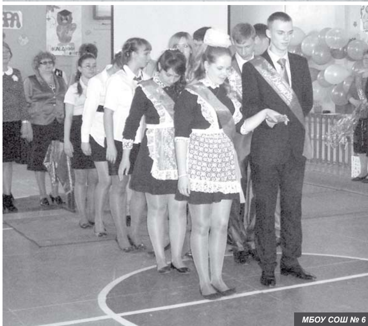
МБОУ СОШ № 6