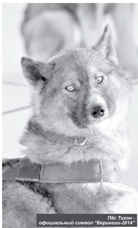
Пёс Тихон - официальный символ «Берингии-2014»

Жители Усть-Камчатского района встретили «Берингию-2014»