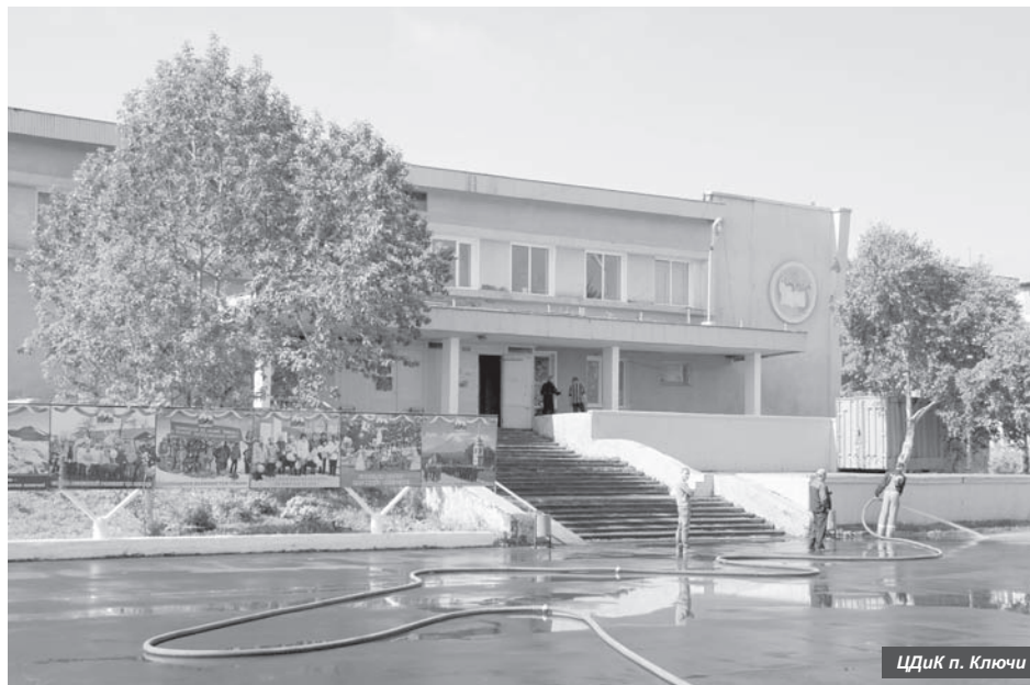
ЦДик п. Ключи

- Центр досуга и культуры в этом году приобретёт свежий вид: по муниципальной программе «Развитие культуры в Ключевском сельском поселении на 2014-2018 годы» будет обустроен новый фасад здания, основное финансирование – федеральное. Конкурс объявлен, поступило уже девять заявок.