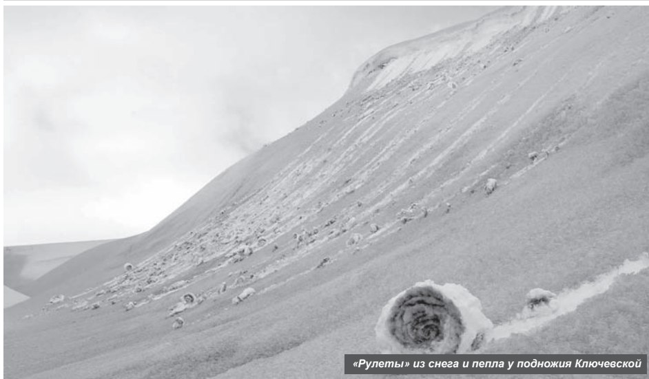
«Рулеты» из снега и пепла у подножия Ключевской

В настоящее время сразу три вулкана, расположенные в Усть-Камчатском районе, проявляют активность.