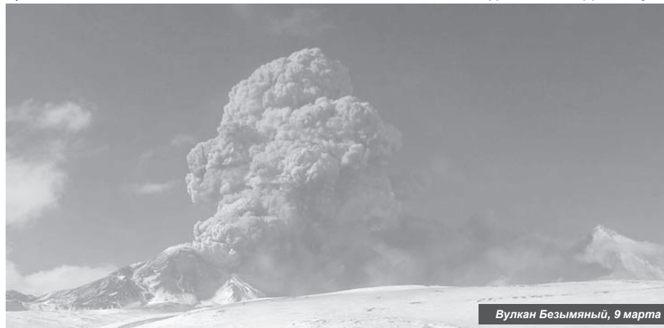
Вулкан Безымянный, 9 марта