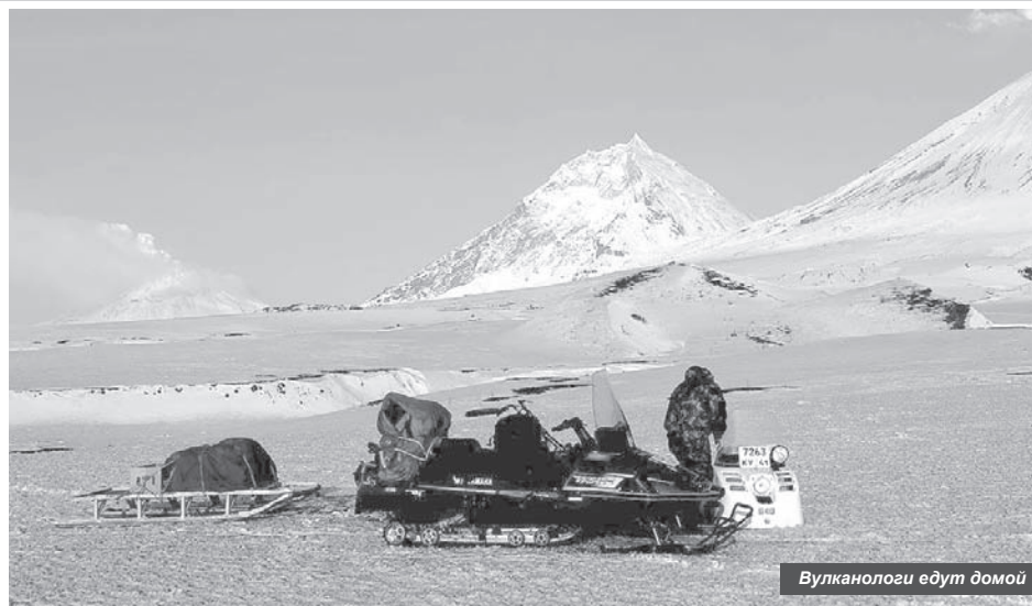
Вулканологи едут домой

При этом ещё в конце марта фумарольная активность исполина была крайне высокой. Основная деятельность происходила на западном склоне купола. Учёные думают, что там произошло разрушение постройки купола во время извержения 9 марта.