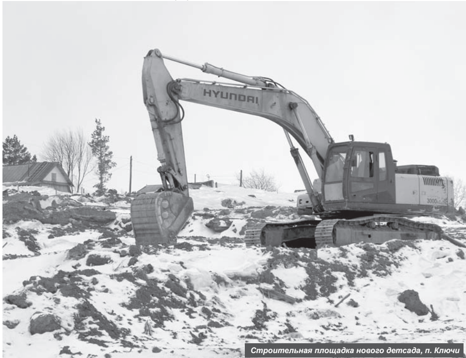
Строительная площадка нового детсада, п. Ключи