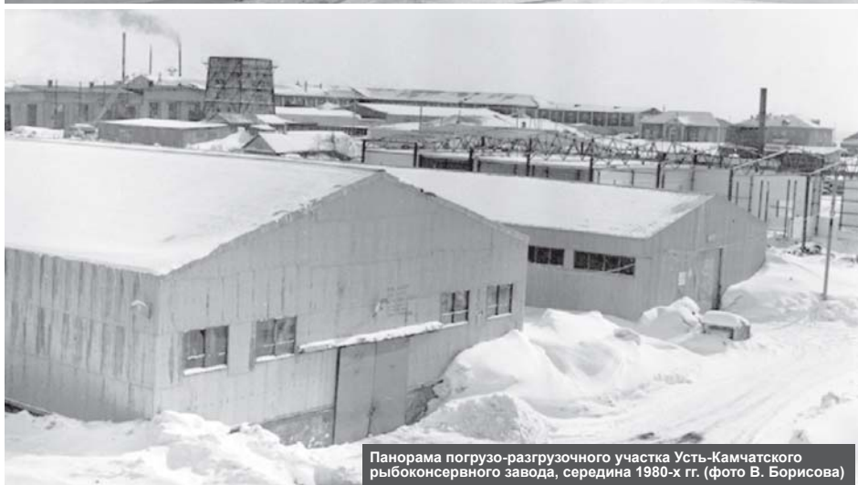
Панорама погрузо-разгрузочного участка Усть-Камчатского рыбкооперативного завода, середина 1980-х гг.

Сегодня предлагаем вашему вниманию занимательный материал о том, как жили в районном центре в XX веке.