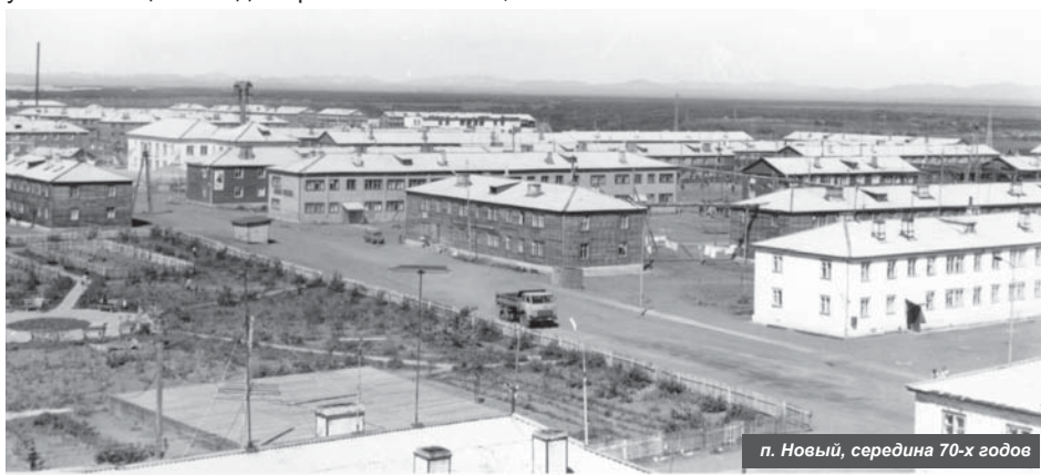
п. Новый, середина 70-х годов