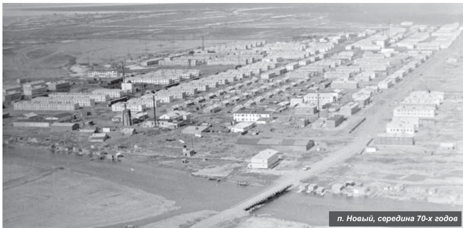
п. Новый, середина 70-х годов

14 октября жители Усть-Камчатки отметят очередную годовщину со дня образования посёлка. В нынешнем году нашей малой родине исполняется 284 года. И в канун торжества мы открываем в нашей газете одноимённую рубрику, в которой будем рассказывать об интересных исторических фактах Усть-Камчатки, о заслуженных жителях посёлка и другом.