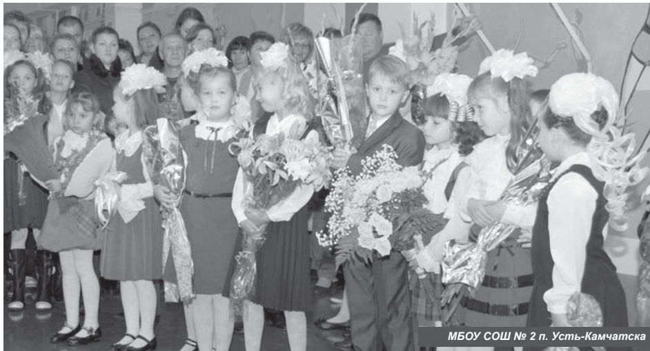
МБОУ СОШ № 2 п. Усть-Камчатка

«Много людей нам помогало, потому что очень сложно было выстроить все ниточки воедино. Мы благодарны и коллективу «Устькамчатрыбы», и родителям, и министру культуры края, и