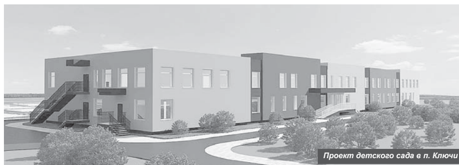
Проект детского сада в п. Ключи

Впервые за всё время на Камчатке проводится асфальтирование улиц и