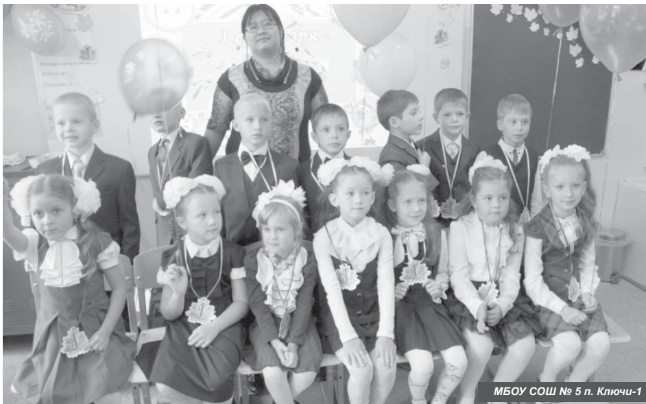
МБОУ СОШ № 5 п. Ключи-1

всем, кто оказал нам помощь. Для нашей школы это очень значимое событие, потому что мы очень долго ждали хороший инструмент. А этот рояль отличного качества, южно-корейского производства. Чтобы создать красивую атмосферу в зале, мы заказали шторы «Маркиз», вуаль для рояля, упаковали его, как подарок, и предоставили честь разрезать ленточку нашему спонсору. И преподаватели, и дети просто счастливы, что нам подарили та-