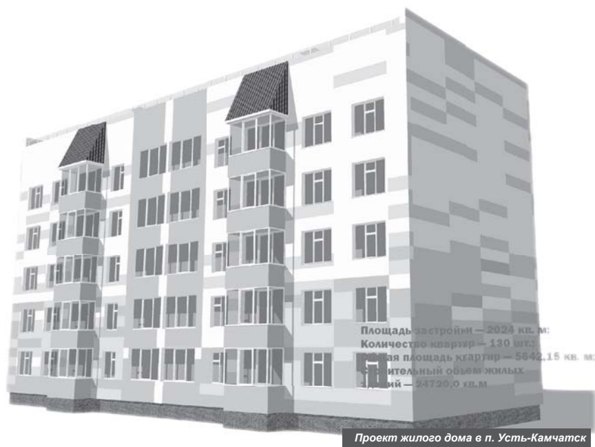
Площадь застройки – 2024 кв. м; Количество квартир – 130 шт.; Жилая площадь квартир – 5642,15 кв. м; Объём работ по капитальному ремонту – 54720,0 кв. м