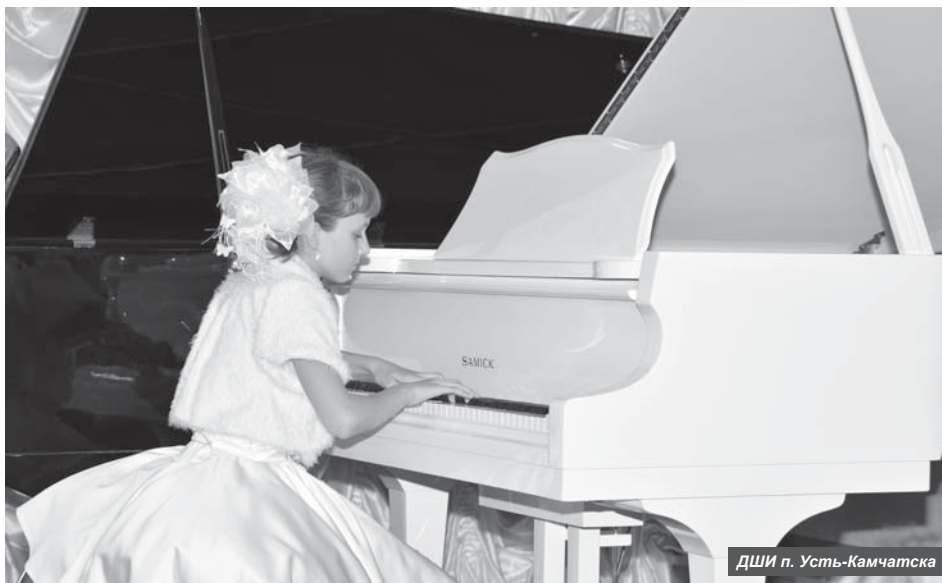
ДШИ п. Усть-Камчатка