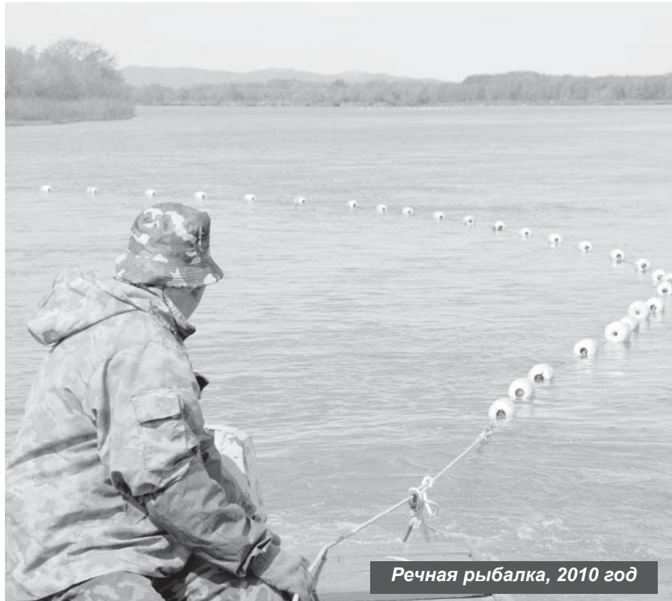
Речная рыбалка, 2010 год