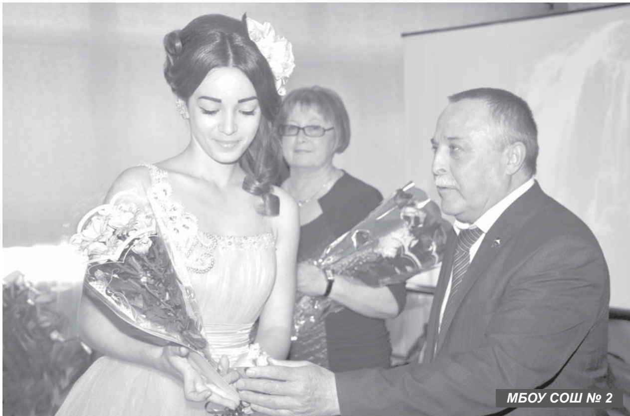
МБОУ СОШ № 2

Одиннадцатиклассники Усть-Камчатского района простились со школой