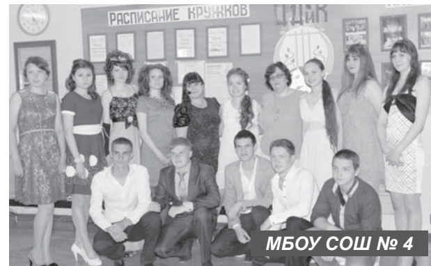
МБОУ СОШ № 4

ников с окончанием школы и подарили памятные подарки. Традиционно выпускники украсили одну из плит перед школой надписью «Спасибо вам, родные! Ваши дети-2015 г.».