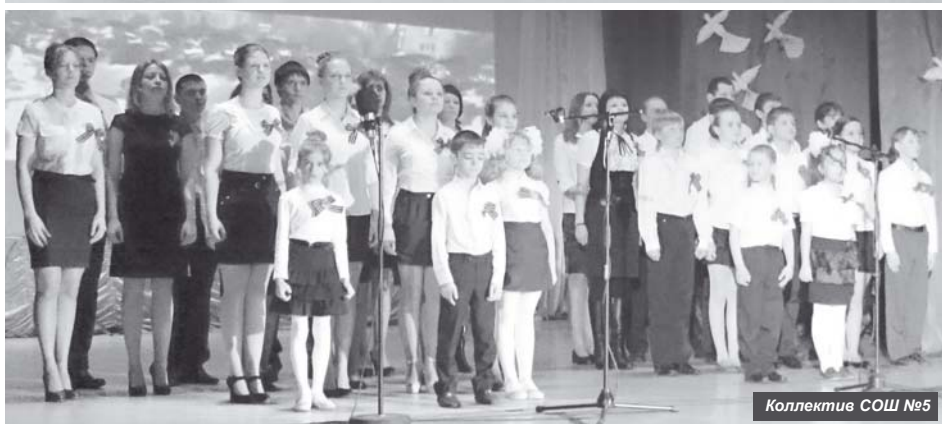
Коллектив СОШ №5

Всё ближе 70-ая годовщина Великой Победы русского народа, и всё больше мероприятий – спортивных, творческих, развлекательных – проводятся в Усть-Камчатском районе к этой священной дате. В Ключах в один день проведены спортивное и музыкальное соревнования.