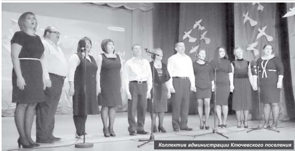
Коллектив администрации Ключевского поселения

В п. Ключи в один день состоялись сразу два мероприятия, посвящённые 70-летию Великой Победы, – лыжные гонки и фестиваль-конкурс военной песни.