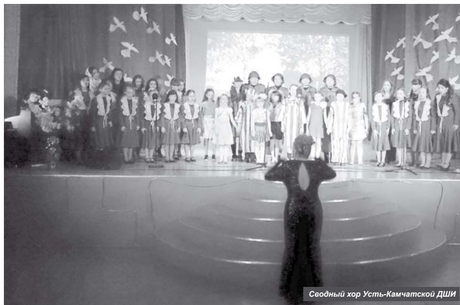
Сводный хор Усть-Камчатской ДШИ

– Данный фестиваль-конкурс был впервые проведён в Ключах. Он приурочен к 70-летию Победы над фашистскими захватчиками, а также организован для того, чтобы молодое поколение знало военные песни, которые помогали русскому народу пережить все тяготы войны. В дальнейшем мы планируем сделать фестиваль ежегодным, – пояснила цель конкурса пред-