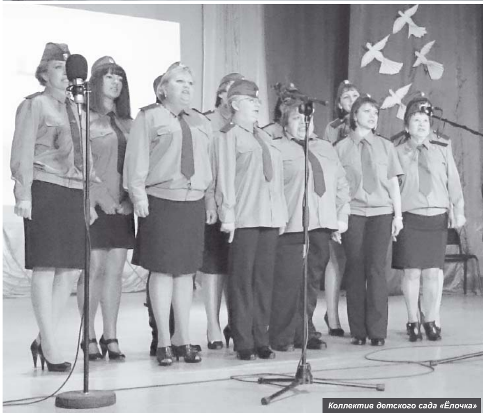
Коллектив детского сада «Ёлочка»