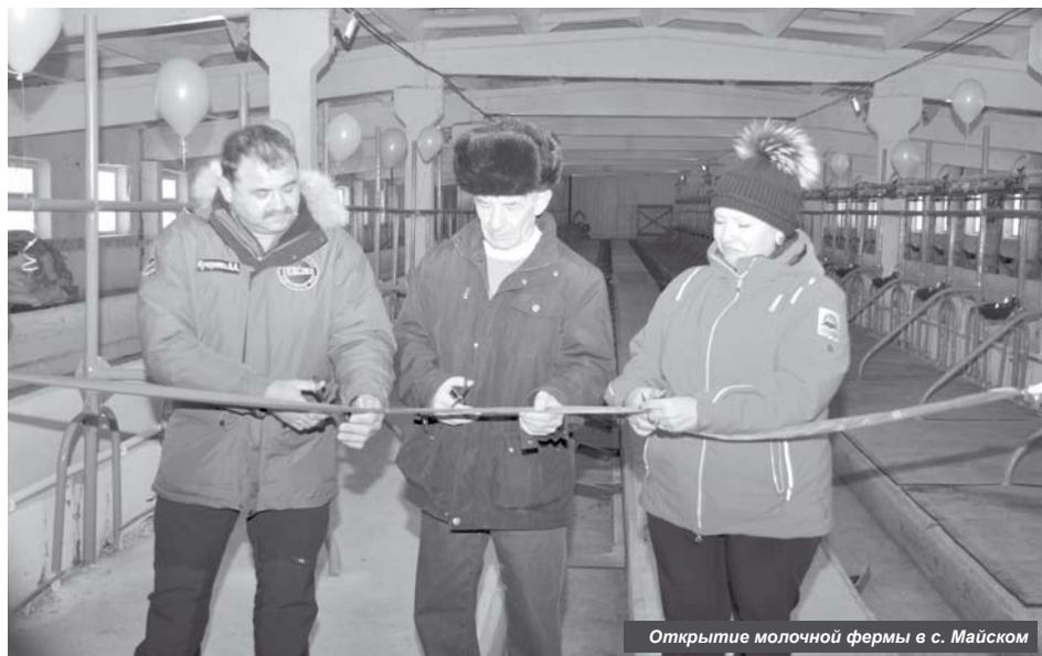
Открытие молочной фермы в с. Майском

Не обошлось за этот год без сюрпризов матушки-природы. 30 мая сель перекрывало около 300 метров дороги Ключи-Усть-Камчатск. Поток грязи, земли и камней сошёл на 323-ем км трассы. Это произошло из-за активного таяния снега на вулкане Шивелуч. Благодаря незамедлительно начавшимся восстановительным работам транспортное сообщение возобновилось уже через три дня.