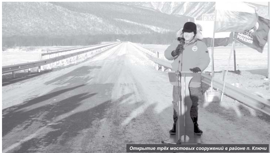
Открытие трёх мостовых сооружений в районе п. Ключи

Очередной лист своей истории перевернул Усть-Камчатский район. Какие же запомнившиеся события вписались в 88-ую страничку жизни района?