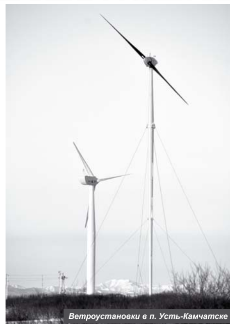
Ветроустановки в п. Усть-Камчатске

А в селе Майском благодаря настойчивости и обоснованию причин бывшим главой района была оказана краевая помощь индивидуальному предпринимателю, и открыта в декабре прошлого