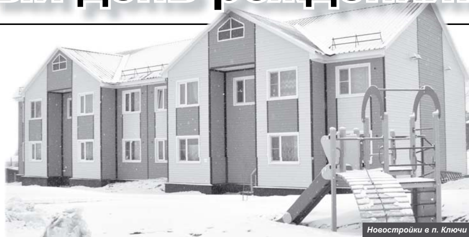
Новостройки в п. Ключи

Работа с молодёжью даёт свои положительные результаты. Хороший тренерский состав, подготавливающий