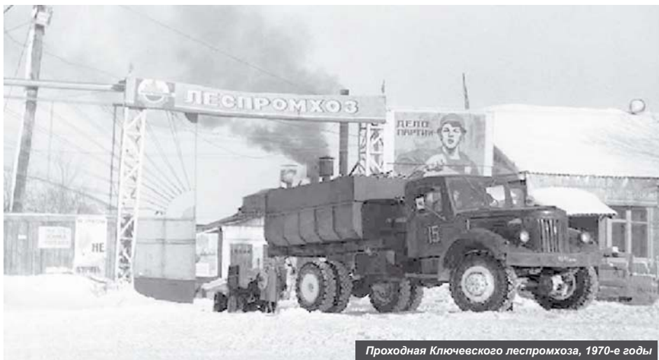
Проходная Ключевского леспромхоза, 1970-е годы

Ключевской леспромхоз (ЛПХ) перестал существовать в 2002 году, но на протяжении 68 лет он был ведущим предприятием в посёлке Ключи.