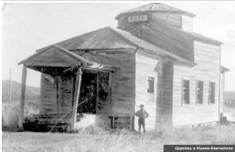
Церковь в Нижне-Камчатске

Мы продолжаем рубрику «Наш район всегда будет славен!», приуроченную к 89-й годовщине со дня образования Усть-Камчатского района.