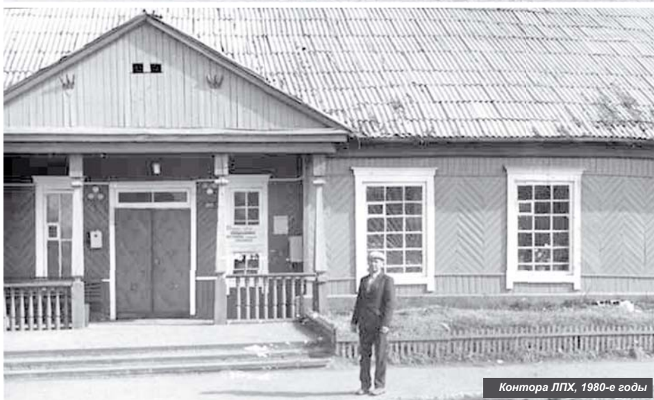
Контора ЛПХ, 1980-е годы