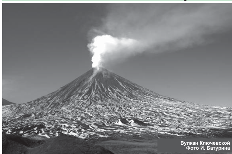
Вулкан Ключевской

Последний месяц чуть ли не ежедневно фиксируются пепловые выбросы вулканов Ключевского и Шивелуча. Весь год повышенную активность проявляют два исполина, находящиеся на территории Усть-Камчатского района. С середины сентября в Усть-Камчатске дважды выпал вулканический пепел.