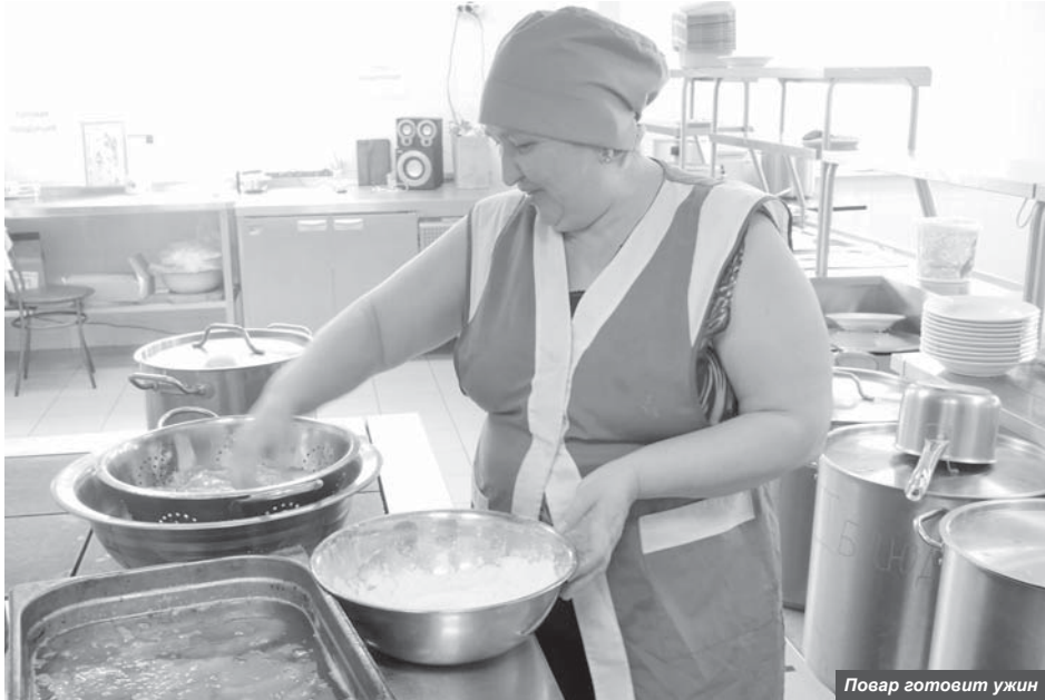
Повар готовит ужин