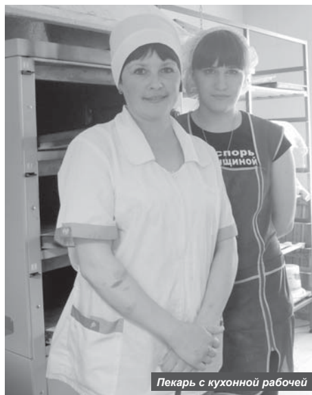
Пекарь с кухонной рабочей

Надежду на большие уловы выразил и заведующий производством, который в завершении беседы поделился планами по дальнейшему развитию предприятия.