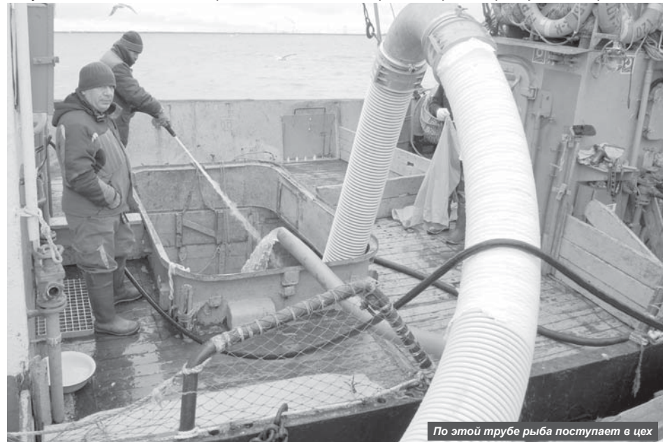
По этой трубе рыба поступает в цех