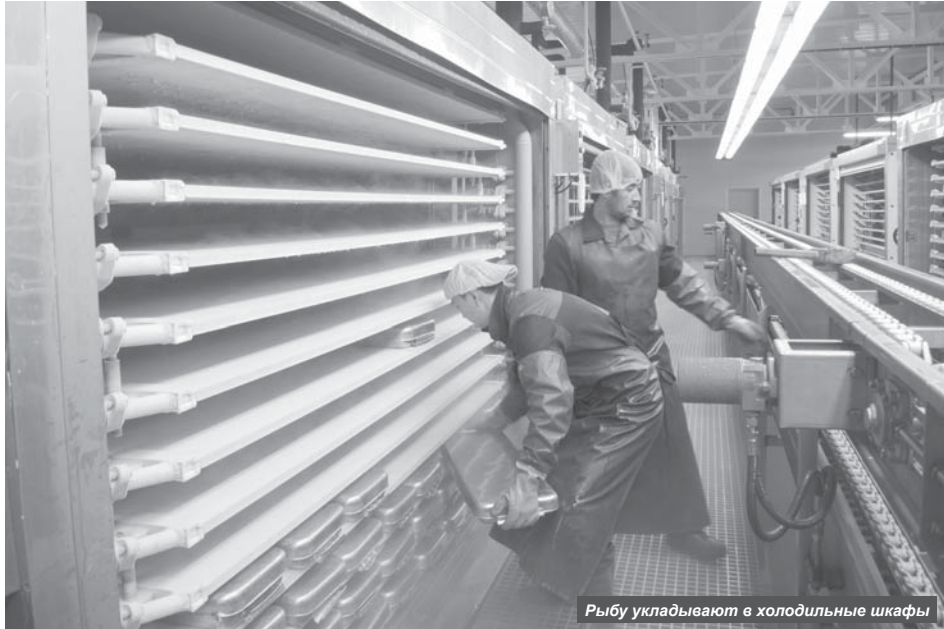
Рыбу укладывают в холодильные шкафы