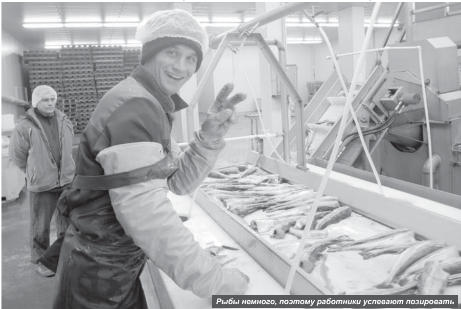
Рыбы немного, поэтому работники успевают позировать

Кухня отличная, хороший коллектив, мы сработались. Всего нас шестеро – два повара, пекарь и три кухонные рабочие.