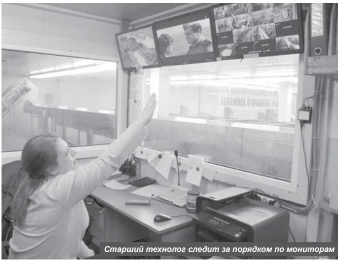
Старший технолог следит за порядком по мониторам