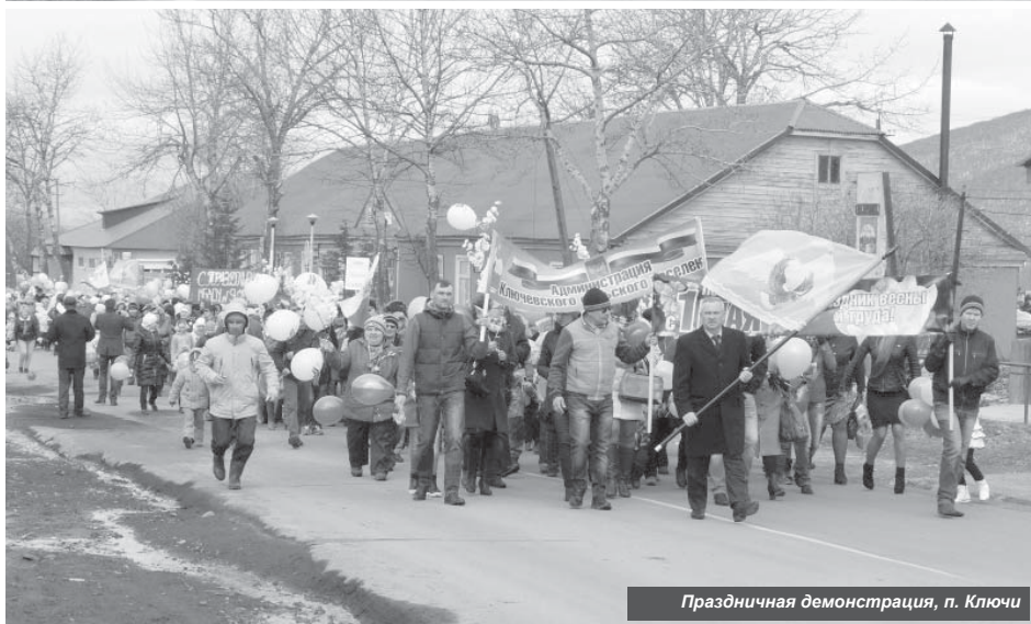
Праздничная демонстрация, п. Ключи