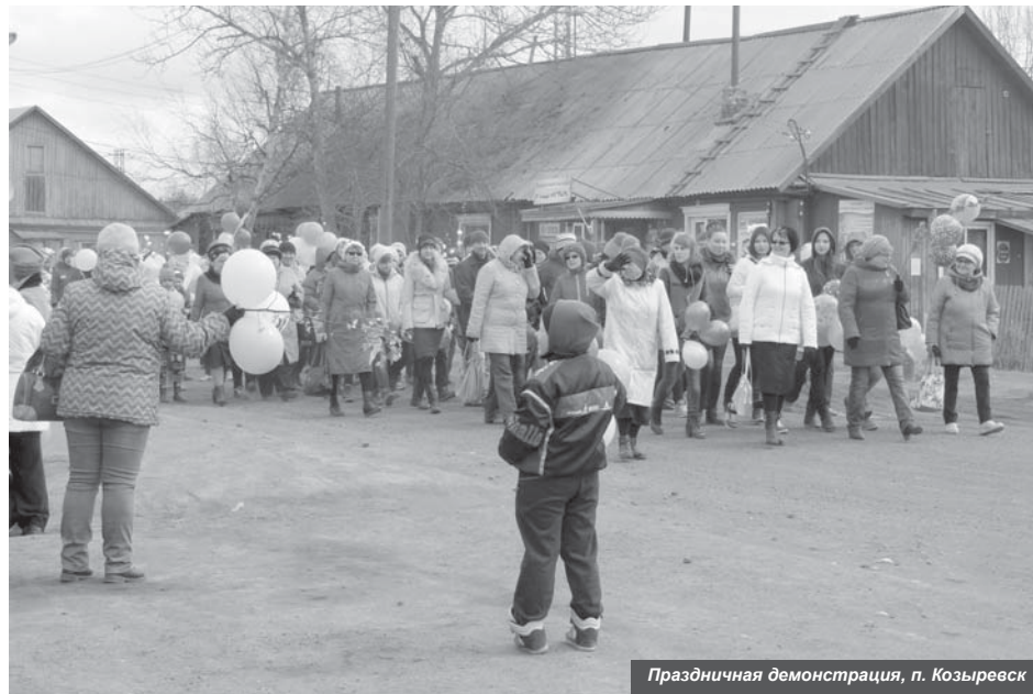
Праздничная демонстрация, п. Козыревск