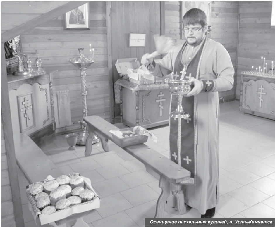
Освящение пасхальных куличей, п. Усть-Камчатск