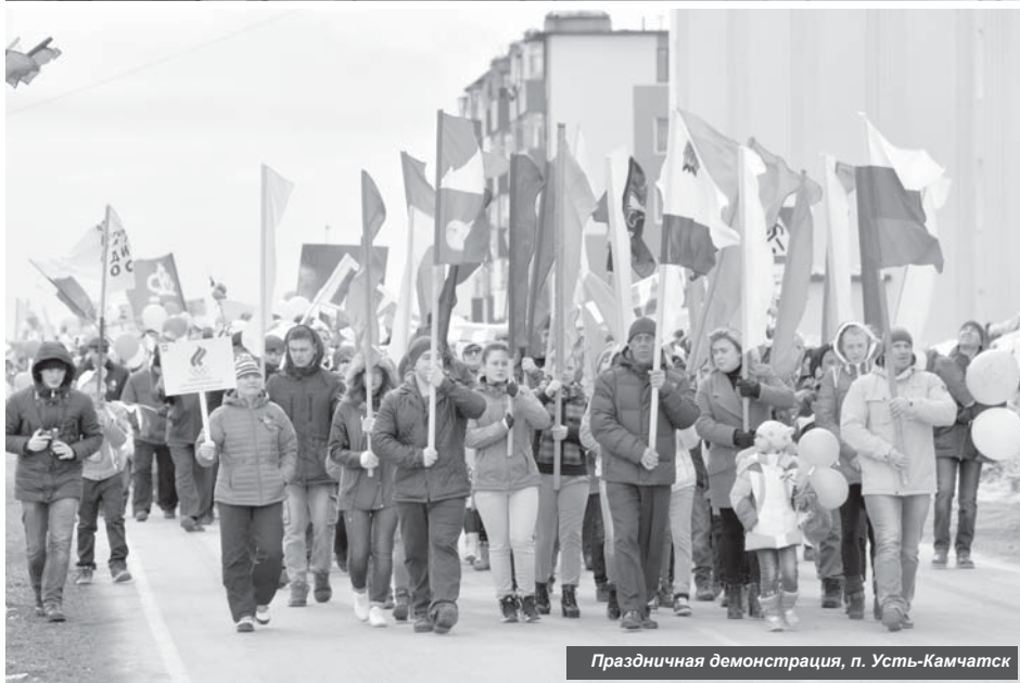
Праздничная демонстрация, п. Усть-Камчатск