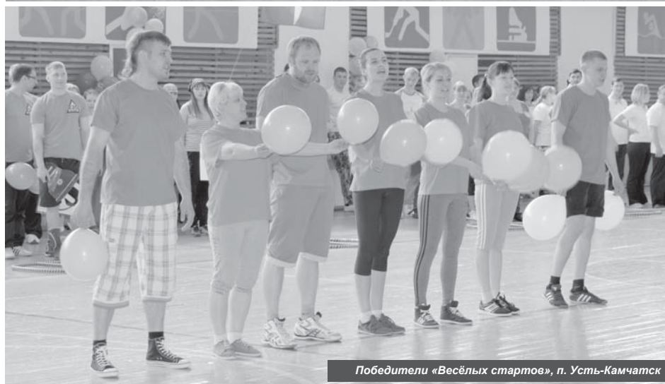
Победители «Весёлых стартов», п. Усть-Камчатск