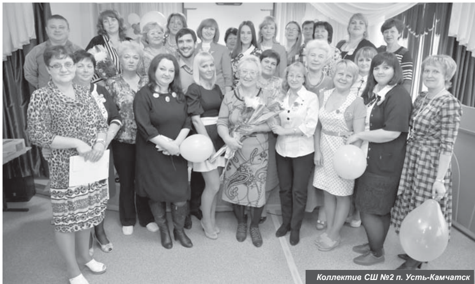
Коллектив СШ №2 п. Усть-Камчатск

69 женщин и всего 18 мужчин – таким составом встретил 8 Марта коллектив Усть-Камчатской школы № 2.