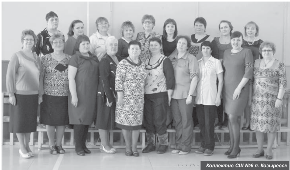
Коллектив СШ №6 п. Козыревск

Так сложилось, что в школьных коллективах преобладают представительницы прекрасного пола и в Международный женский день всё внимание коллег-мужчин и учеников приковано именно к ним. Исключением не стала МБОУ средняя школа № 6 п. Козыревска.