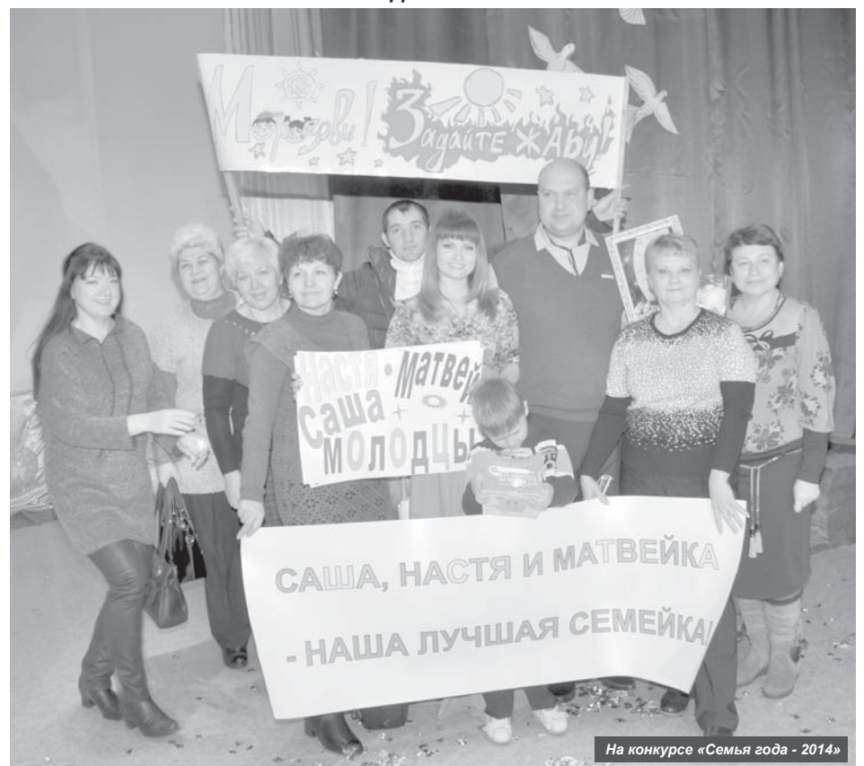
На конкурсе «Семья года - 2014»