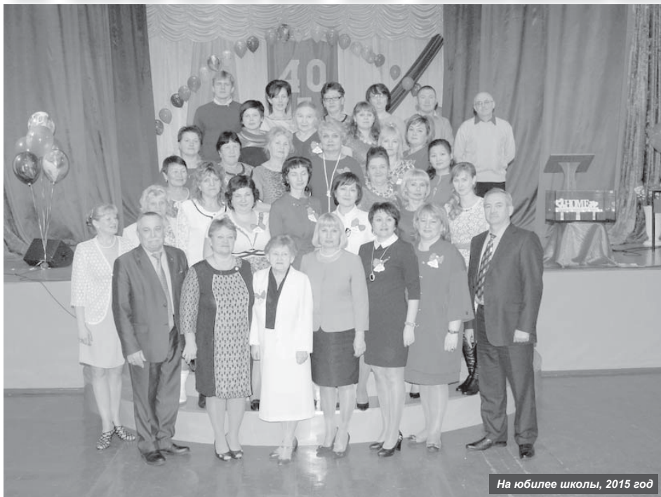
На юбилей школы, 2015 год