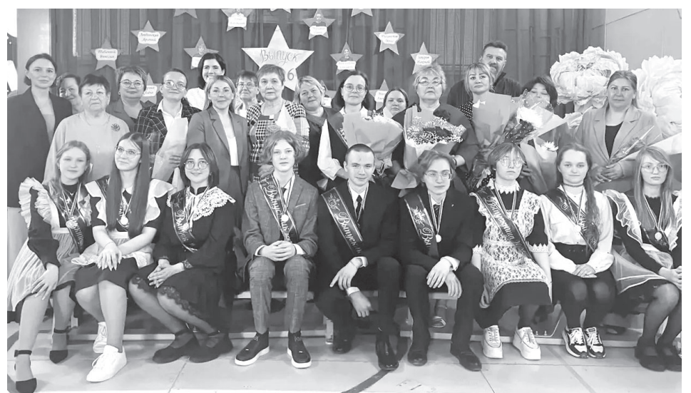
Выпускники СШ № 6 посёлка Козыревска