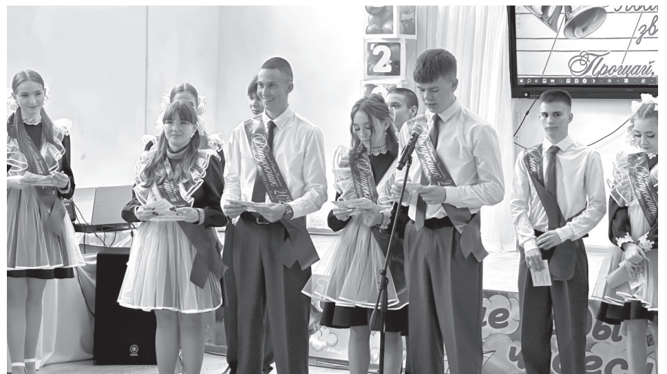
Выпускники СШ № 5 посёлка Ключи-1