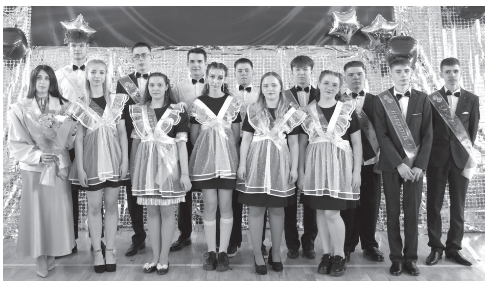
Выпускники СШ № 2 посёлка Усть-Камчатска