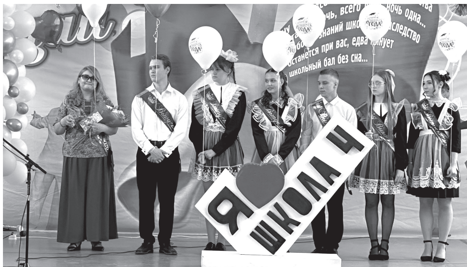
Выпускники СШ № 4 посёлка Ключи

Официальную часть везде завершил тот самый звонок, символ прощания с детством и старта во взрослую жизнь. Теперь у ребят главные испытания — экзамены. А девятиклассникам предстоит сделать непростой выбор — остаться за школьной партой ещё два года или пойти по профессиональному пути.