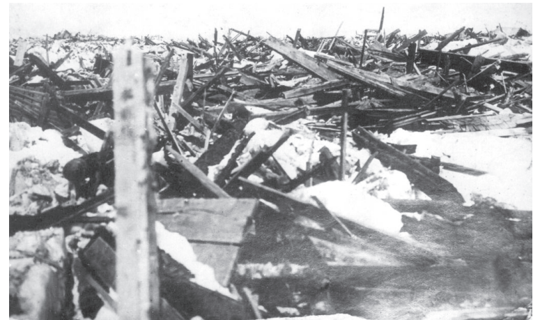
■ Последствия цунами 14 апреля 1923 года. Район Дембиевской косы

Именно на Переволоке группа новых поселенцев, прибывших с материка на лососёвую путину, решила основать новый населённый пункт. Привлекательность места была очевидна: морской залив изобиловал рыбой, а расположенный рядом массив мыса Камчатского до начала XX века был богат бурим медведем, соболем, лисой и даже диким оленем. Нерпичье озеро в свою очередь славилось отличной рыбалкой на корюшку и сельдь. В паре километров от Переволоки, в сторону мыса, находилось небольшое ключевое озеро, исток которого впадал в Камчатский залив.