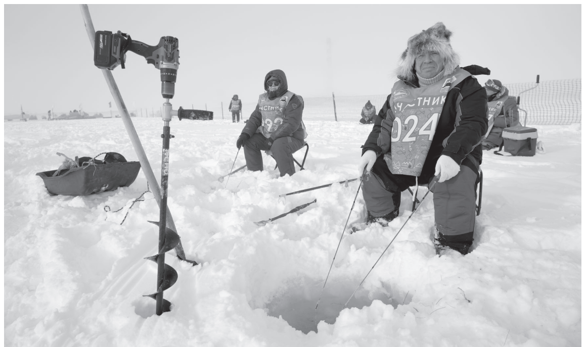
«Удача рыбака», 2025 год

«Камбала и другие — тоже рыба» — здесь почёт и призы получат те, кому на крючок попадёт не корюшка, а иная рыба (по наибольшей массе).