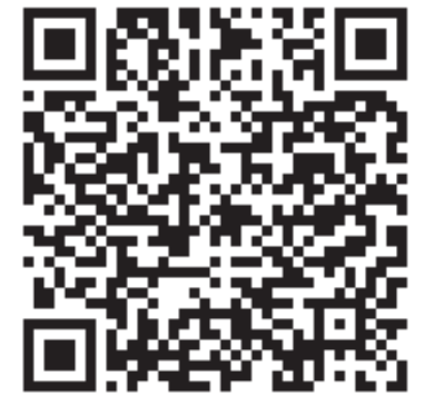
ГРАФИК отчётов перед населением участковых уполномоченных полиции Усть-Камчатского МО МВД России о проделанной работе за 2025 год

Присоединиться к группе «Лавки добра» можно в мессенджере «Макс». Для этого отсканируйте QR-код камерой своего мобильного телефона — и перейдите по ссылке.