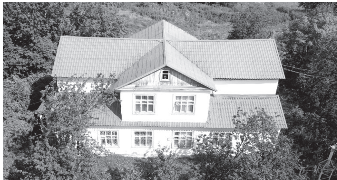
Камчатская вулканологическая станция. Посёлок Ключи. Август 2025 года