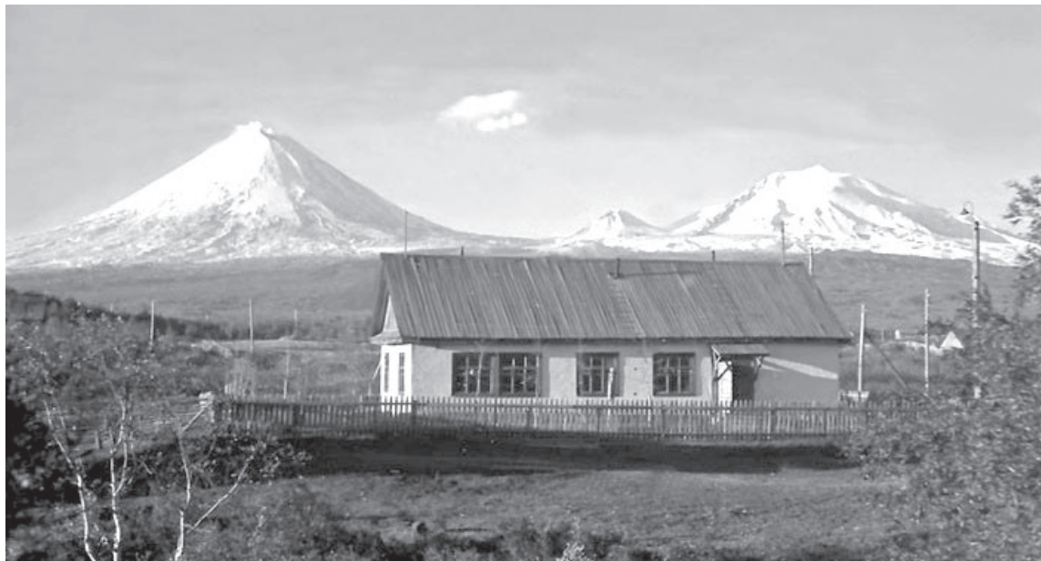
Камчатская вулканологическая станция. 1952 год