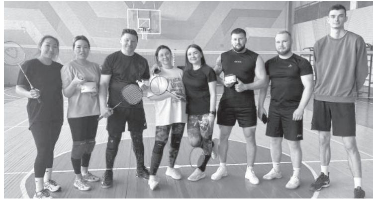
📷 Участники турнира по бадминтону в п. Усть-Камчатске

16 жарких поединков, невероятная воля к победе и настоящий бойцовский характер – так