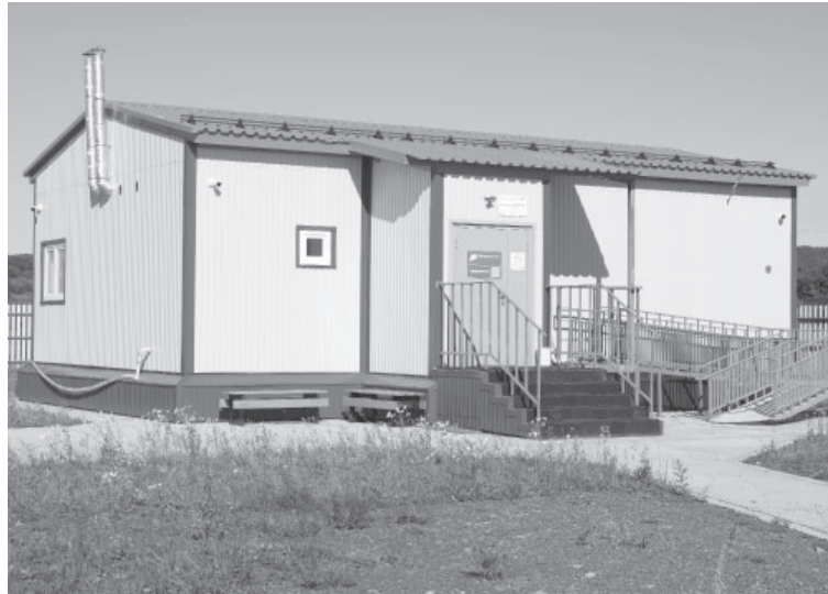
Фельдшерский здравпункт в селе Крутоберёгово

Губернатор. Камчатка добилась беспрецедентного улучшения медицинской инфраструктуры за 5 лет.