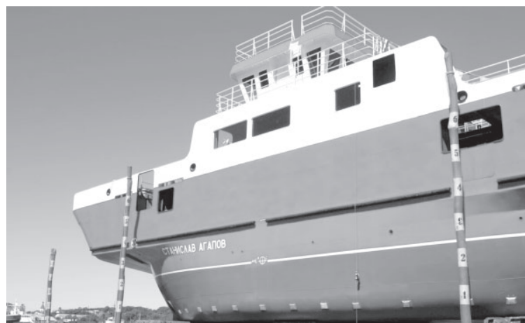
► Новый автомобильно-пассажирский паром «Станислав Агапов»

далённых районах и посёлках», – сказал Владимир Солодов.