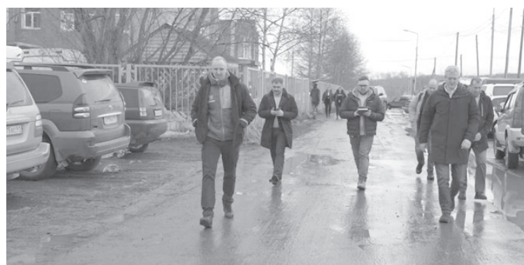
► Проверка дорог в п. Ключи

«Я сегодня специально выделил время, встретился с новосёлами и обсудил, как они оценивают квартиры. Могу сказать, что все они очень довольны, и те квартиры, которые уже введены в эксплуатацию, все заселены. Это в общей сложности 48 квартир: 24 квартиры в одном доме и по 12 в двух других. Это залог того, что Усть-Камчатск будет развиваться, что востребованные специалисты смогут получить достойные жилищные условия, и качество жизни для всего посёлка будет обеспечено. А Камчатка будет развиваться в том числе и в от-