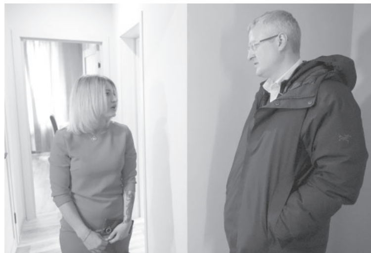
► Встреча с новосёлами