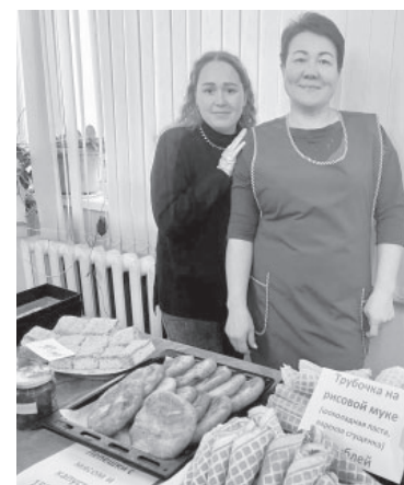
Ярмарка «Из дома с любовью»

Память погибших, выполнявших свой воинский долг почтили минутой молчания. Праздник завершился ярким выступлением оркестра войсковой части и воспитанников детского сада.