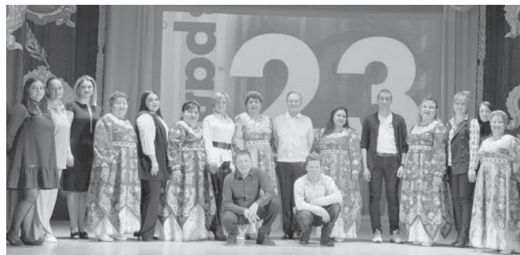
Концерт в посёлке Ключи

Поздравления прозвучали также от председателя Совета народных депутатов округа