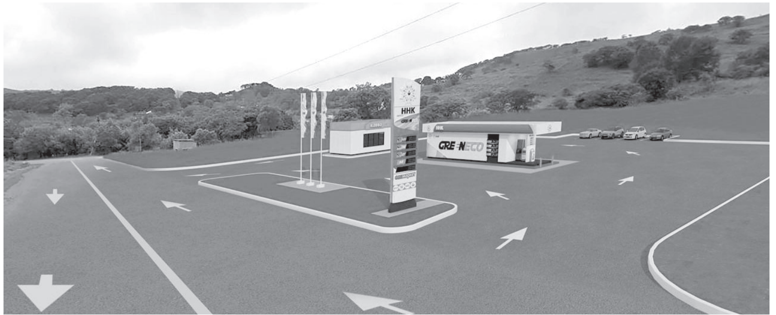
📷 Проект новой АЗС в посёлке Ключи

Инфраструктура. Летом 2025 года в п. Ключи появится новая автозаправочная станция.