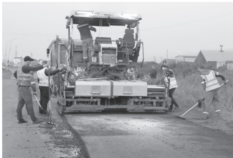
■ Асфальтирование в п. Усть-Камчатске