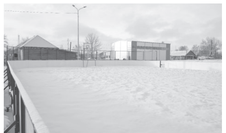
■ Хоккейная площадка в п. Козыревске

В рамках проекта «Решаем вместе», инициированного губернатором Владимиром Солодовым, в Ключевском поселении обустроили парк «Ключевской». Построили беседку, установили декоративные элементы, освещение и ограждение, заасфальтировали дорожки, высадили саженцы,