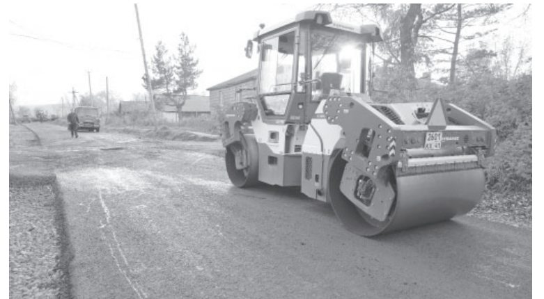
■ Асфальтирование в п. Ключи