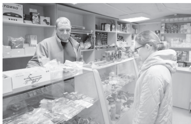
☉ Магазин автозапчастей в п. Усть-Камчатске