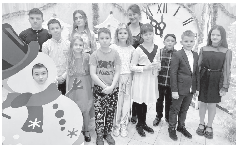
После завершения представления каждый маленький гость получил сладкий подарок с открыткой, содержащей поздравление с Новым годом от губернатора Камчатского края.

Также в рамках праздника для детей состоялась новогодняя программа: ростовые куклы, танцы, флэшмобы, мастер-классы, аквагрим и т.д.