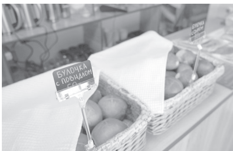
☉ Кафе-пекарня «Антошка» в п. Усть-Камчатске