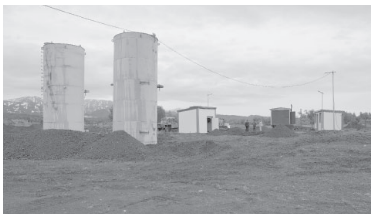
■ Новая водонасосная станция с. Крутоберёгова

Начат ремонт мемориала памяти погибшим в годы ВОВ «Скорбящая мать» в мкр. Новый Посёлок по ул. Горького, в частности, изготовлены мемориальные таблички. Его завершение планируется во втором квартале 2025 года.