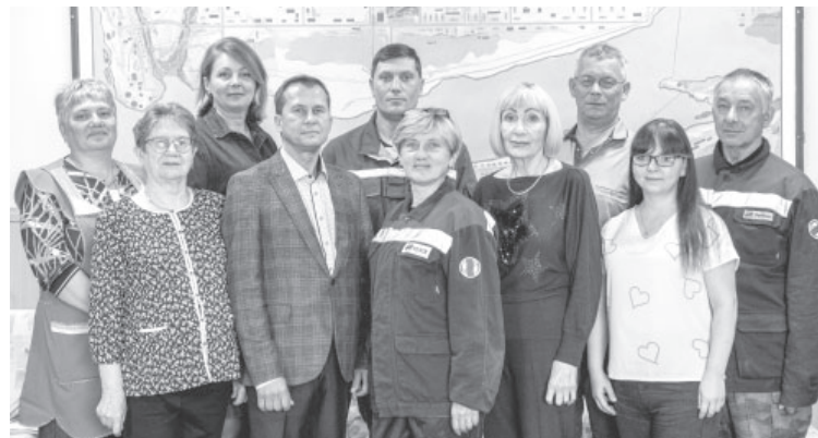
Коллектив дизельной электростанции в п.Усть-Камчатске

АО «ЮЭСК» представляет собой сложную производственную структуру, обеспечивающую в Камчатском крае 28 населённых пунктов электрической энергией и 11 населённых пунктов тепло-