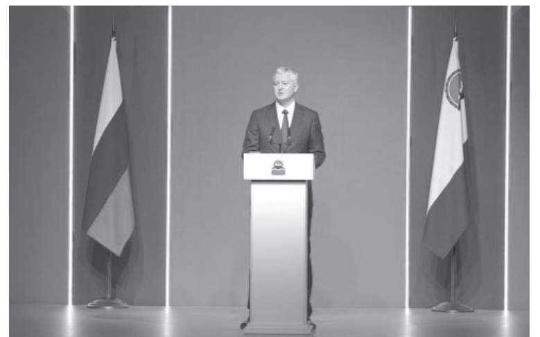
Губернатор Камчатского края Владимир Солодов

По его словам, в крае действует 30 региональных и муниципальных мер поддержки для участников СВО и членов их семей. Уже с 2025-го года участникам специальной военной операции и членам их семей планируется предоставить более 230 земельных участков. При этом глава региона предло-