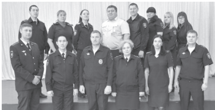
Коллектив Усть-Камчатского МО МВД России

Основными направлениями работы для усть-камчатской полиции остаются предотвращение