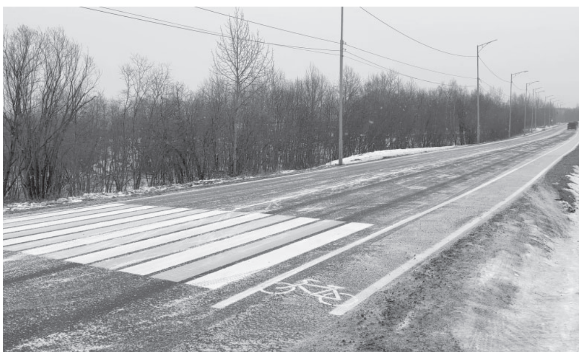
Участок от 263-го км краевой трассы Мильково-Ключи-Усть-Камчатск до въезда на территорию военного городка