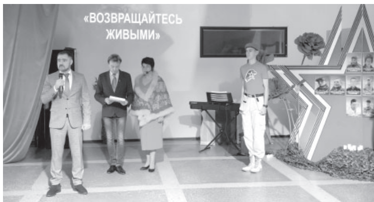
Встреча-реквием «Возвращайтесь живыми!»

В Усть-Камчатске в Центре культуры и досуга состоялась встреча-реквием «Возвращайтесь живыми!», посвящённая специальной военной операции. Мероприятие началось с минуты молчания в память о павших земляках... На встречу были при-