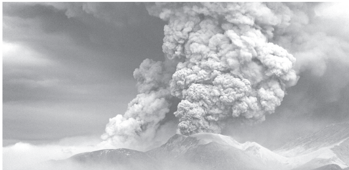
Извержение вулкана Шивелуч 18.08.2024