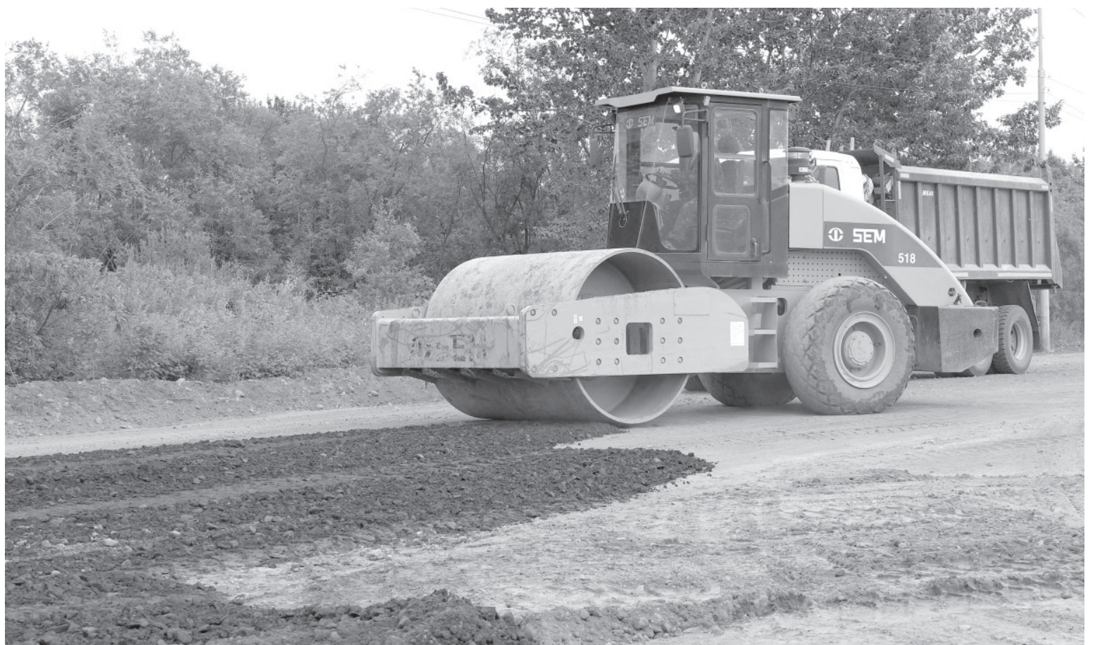
Подготовительные работы перед асфальтированием участка трассы Мильково-Ключи-Усть-Камчатск

Дороги. Работы по ремонту дорожного полотна начались в посёлке Ключи.